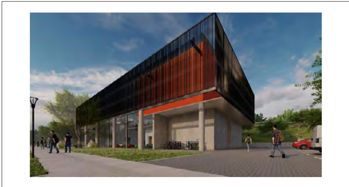
FIGURA 4. Imagen Render de la Tecnoteca de Paraná, Distrito del Conocimiento

d. PARANÁ DC. Edificio para la Radicación de Empresas de la Economía del Conocimiento (Figura 5): Se firmó un convenio que permite la licitación para la construcción de un edificio de 6200m 2 (incluye circulación del edificio y vehicular) que se erigirá en el Distrito del Conocimiento. El edificio propone ser un espacio abierto a las nuevas formas productivas propias de la Economía del conocimiento, tendientes al trabajo cooperativo, bajo altos estándares de calidad e innovación. Se busca ofrecer dentro del Distrito un edificio que funcione para la radicación de empresas, emprendedores y profesionales del sector. En la actualidad la iniciativa está a la espera de la licitación para inicio de obra.