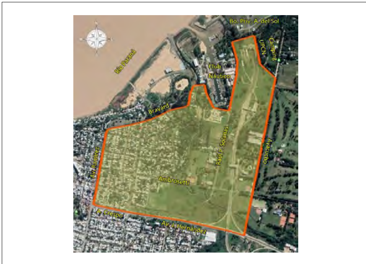
FIGURA 1. Mapa del Distrito del Conocimiento, ciudad de Paraná