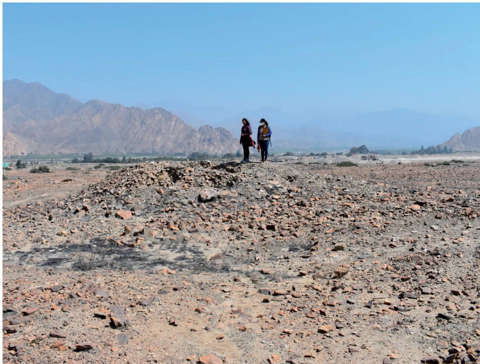
Conjunto de hitos 3