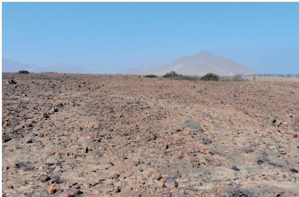
Foto del camino asociado a Pelenque 1.

Es destacable mencionar la ausencia de estructuras monumentales o de arquitectura pública en el sitio. También cabe mencionar la falta de estructuras hidráulicas y/o agrícolas, siendo que estas son comunes en los sitios correspondientes al Valle medio de Chicama.