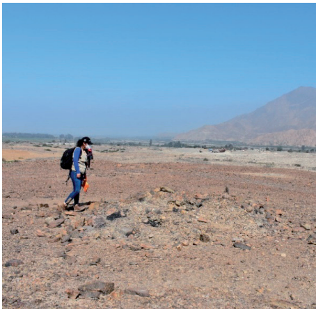
Foto de una de las estructuras en U(izquierda), Ortofoto en la que se aprecian ambas estructuras (derecha).