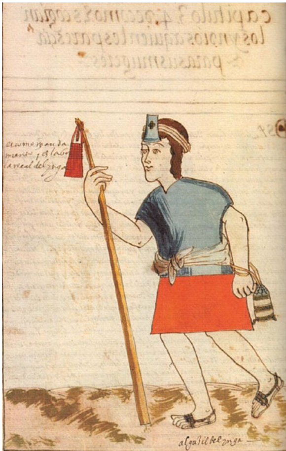
Figura 1: «Alguacil del Ynga». De Martín de Murúa, Historia y genealogía de los reyes incas del Perú (1590). Manuscrito Galvin, f. 86v

El simbolismo de los colores descrito por los ancianos del Cuzco está reproducido en dibujos a color preparados por el sacerdote Martín de Murúa. En las láminas 1 y 2 se representa la túnica azul de un alguacil inca enviado a ejecutar una orden, así como la litera azul destinada para su transporte. La borla o insignia para la frente descrita por los ancianos incas puede ser vista en ambas ilustraciones, aunque esta aparece sujeta al bastón llevado por el funcionario y no a su túnica (Murúa 2004 [1590]: 86v, 54v).