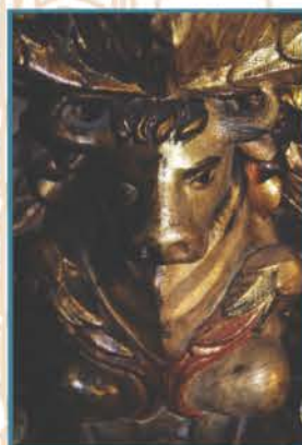
Mitad de limpieza de barniz oxidado en escultura de Lucas (toro alado).

Los materiales empleados en la elaboración del retablo tienden a deteriorarse con el tiempo. Puede notarse que hay problemas como el ataque de xilófagos en las maderas de pino y roble, rajaduras y grietas a causa de las variantes de humedad y temperatura, pérdidas debido a la falta de adhesión en la capa de preparación y en los redorados, craquelados y repintes en la policromía, oxidación y oscurecimiento de los barnices y suciedad acumulada en la superficie debido a la falta de mantenimiento.