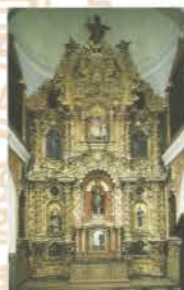
El retablo hacia 1996. Catálogo editado para la recuperación del patrimonio cultural de la Nación por el Banco de Crédito del Perú.

Los materiales empleados en la elaboración del retablo tienden a deteriorarse con el tiempo. Puede notarse que hay problemas como el ataque de xilófagos en las maderas de pino y roble, rajaduras y grietas a causa de las variantes de humedad y temperatura, pérdidas debido a la falta de adhesión en la capa de preparación y en los redorados, craquelados y repintes en la policromía, oxidación y oscurecimiento de los barnices y suciedad acumulada en la superficie debido a la falta de mantenimiento.