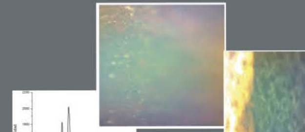
Espectro Raman del oropimente obtenido en una de las alas de la escultura de Marcos (león alado).