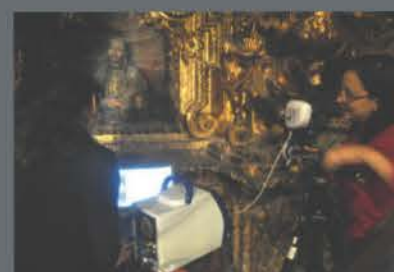
Exámenes del retablo de San Francisco de Borja con un equipo portátil de espectroscopía Raman de la Pontificia Universidad Católica del Perú.

Los pigmentos, al igual que otros materiales, pueden ser iluminados con un láser y emitir señales ópticas, diferentes a la luz incidente, que nos permiten descubrir detalles sobre la estructura molecular de dichas sustancias. Este conjunto de señales, conocido como espectro Raman, es el DNI de las moléculas y puede ser el complemento perfecto a la hora de identificar pigmentos (p.ej. el bermellón-HgS) y discriminar aquellos pigmentos de composición elemental parecida. Por ejemplo, si el análisis con FRX muestra arsénico (As) y azufre (S), el pigmento podría ser oropimente ( As_2S_3 ), rejalgar (alfa- As_4S_4 y beta- As_4S_4 ) o pararrejalgar ( As_4S_4(II) y gama- As_4S_4 ).