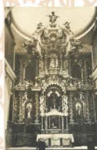
El retablo después de 1940.

A lo largo del tiempo el retablo tuvo una serie de transformaciones, tanto en el sistema de anclaje, como en el sistema decorativo pictórico y escultórico.