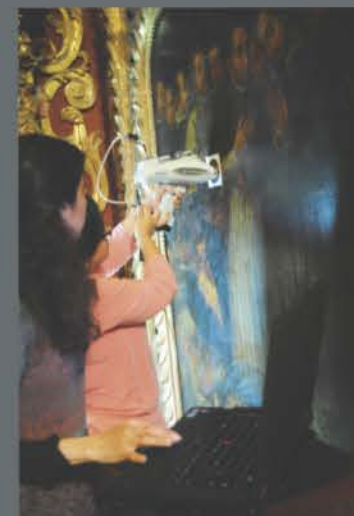
Análisis de un lienzo de la capilla de San Francisco de Borja con un equipo portátil de FRX de la Sección Química de la Pontificia Universidad Católica del Perú.

Toda la materia está compuesta por átomos y en estos átomos tenemos un núcleo (formado por protones y neutrones) y también electrones. Cuando irradiamos estos átomos con rayos X que tengan la energía adecuada, algunos de los electrones del átomo (aquellos que están más cerca al núcleo) se pierden y dejan "huecos". Como el átomo no es estable en esta situación, los electrones más externos bajan de nivel para rellenar estos "huecos" y, cuando lo hacen, se emite "luz". Nosotros no podemos ver esta luz, porque también está en el rango de los rayos X, pero el detector del analizador de FRX sí lo "ve" y con esto genera una especie de huella digital del elemento: un espectro.