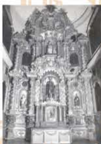
El retablo hacia 1984.