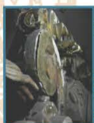
Levantamientos de la capa de preparación y dorados.