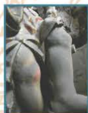
Acumulación de polvo en la superficie.