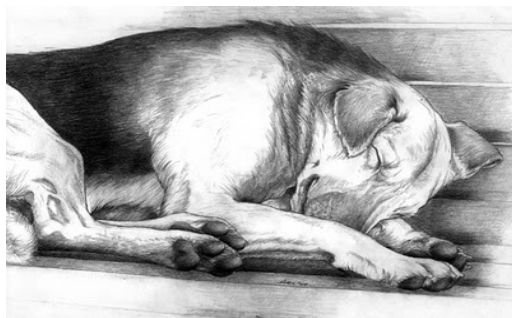
Perro grande acostado de aspecto realista (trazo complejo)