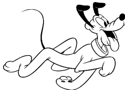
Perro jadeante caricatura (Pluto)