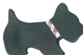
Perro pequeño de aspecto realista (silueta)

Todas las imágenes son expresiones de la idea “perro” y, si cumplen con el requisito de originalidad, cada una de estas formas de expresar la idea “perro”, será protegida por el Derecho de Autor. Por su parte, la idea “perro”, en sí misma, no es atribuible a ninguna persona en exclusividad.