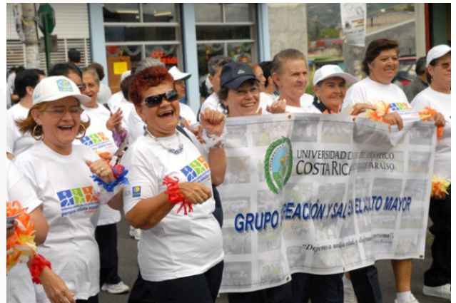
Foto: Adultas mayores en una actividad comunitaria

Por otro lado, mediante la participación en proyectos de trabajo comunal universitario, de extensión cultural y de extensión docente, el PIAM se acerca e incide en las necesidades de la población adulta mayor y de las organizaciones, instituciones y personas vinculadas al trabajo con dicha población. Un ejemplo de las actividades realizadas en este sentido, fue el 3er Congreso Iberoamericano de Universidades para Todas las Edades, realizado en agosto del 2009, dirigido a instituciones educativas, organizaciones, docentes y profesionales que trabajan con y para población adulta mayor, así como para los propios estudiantes de los programas educativos existentes.