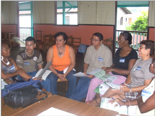
Foto: Participantes del taller de capacitación en la provincia de Limón

torno a la vejez, a los requerimientos de las personas mayores y a las acciones necesarias para construir relaciones más solidarias y respetuosas con ellos y ellas.