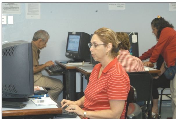
Foto: Estudiantes del PIAM en la clase de principios de computación

Pretende que las y los estudiantes mayores disfruten de las posibilidades que los medios de comunicación tecnológica ponen a su disposición. El módulo contempla los cursos de Principios de computación I, II y III e Internet I y II. Para el segundo semestre del 2010 se ofrecieron 200 cupos para las personas interesadas en estos cursos.