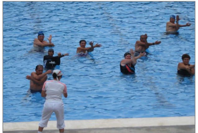
Foto: Estudiantes del PIAM en clase de actividades acuáticas