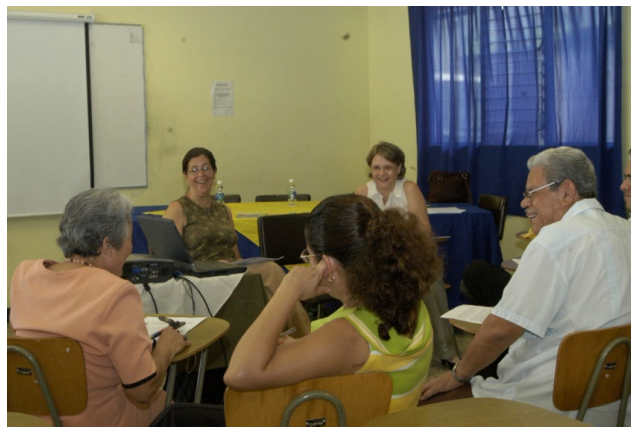
Fotos: Estudiantes del PIAM de diferentes cursos del módulo de gerontología

Este módulo ofrece cursos para fortalecer a las personas en su proceso de envejecimiento, para facilitar la comprensión de los cambios experimentados y de las oportunidades de crecimiento personal que se abren en la etapa de la vejez. Incluye cursos como: higiene mental, espiritualidad, sexualidad y mucho más, inteligencia emocional, entre otros.