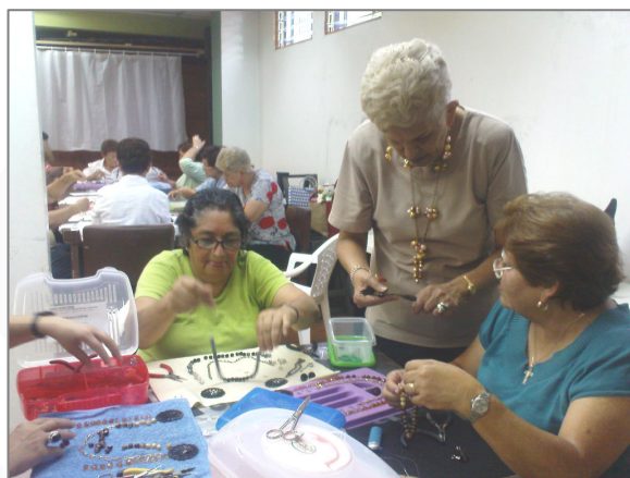
Fotos: Estudiantes del PIAM en las clases de pintura, decoración en cerámica y bisutería