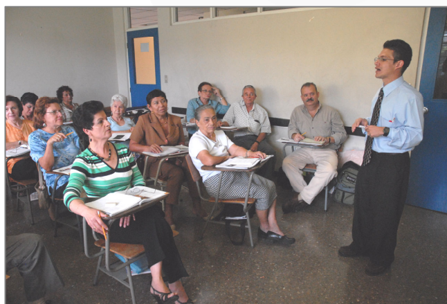
Foto: Estudiantes del PIAM en clases del módulo de inglés

El módulo consta de doce niveles. Promueve la comunicación oral, integrando actividades de lectura, escucha y escritura. Los niveles son: nivel introductorio, básico (niveles I-IV), intermedio-bajo (niveles V-VIII), intermedio-avanzado (niveles IX-XII), e inglés conversacional. En el segundo semestre del 2010 se graduó la primera generación de estudiantes que cursaron el programa completo de inglés.