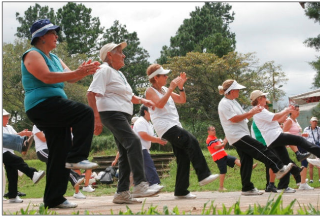
Foto: Personas adultas y adultas mayores del PIAM en clase de aeróbicos.