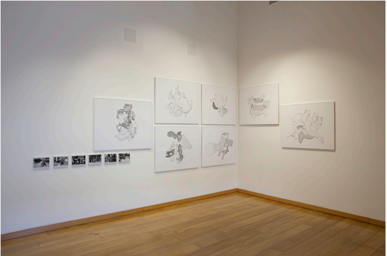
FIGURA 1 Vargas, G. (2021). Colisiones y Ensayos [fotografía digital, vista panorámica de la muestra].