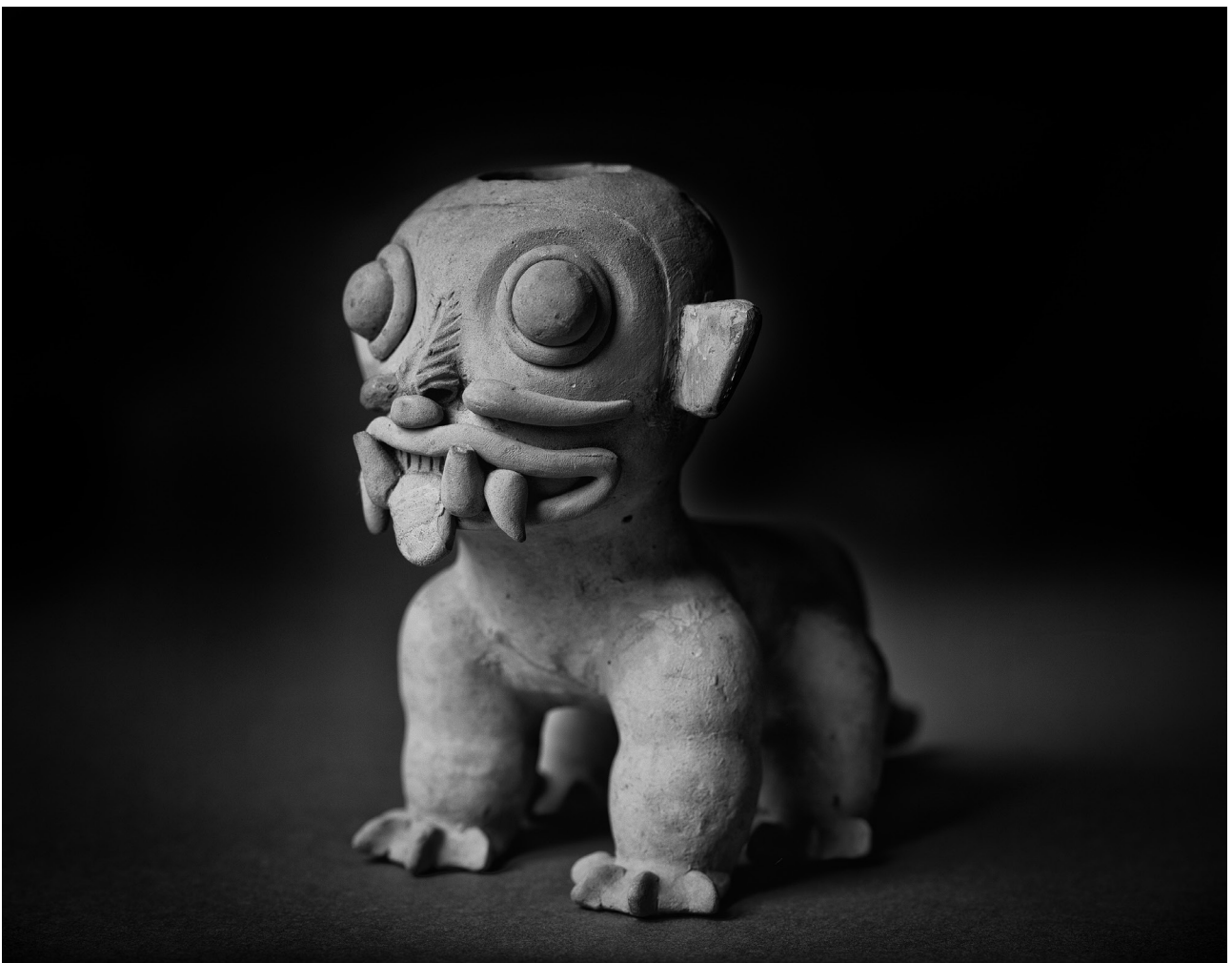
FIGURA 4 Vargas, G. (2021). Figura antropomorfa (felino) Jama Coaque [fotografía]

El proceso de trabajo del proyecto fue el siguiente: primero se seleccionaron las piezas que serían parte de la muestra visitando varias veces la reserva del museo. El museo se caracteriza por tener una de las más importantes colecciones de arte precolombino en Ecuador y, en su exhibición principal, las piezas destacan al estar exhibidas dentro de un bello display museográfico. Mi interés sobre las piezas radicó en explorar la reserva y poner en escena piezas que usualmente no ven la luz en la exhibición principal. Dejé que la intuición me llevara y dejé que las piezas de la reserva me hablaran. Seleccioné aproximadamente 60 piezas de la reserva, la mayoría figuras de animales y muchas de la cultura Jama Coaque. Solo tuve como consigna dejar fuera imágenes que resultasen comunes en Ecuador por su difusión, como son las Venus de la cultura Valdivia o diversas representaciones de la masticación de la hoja de coca.