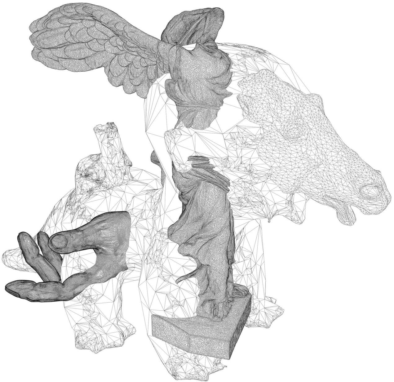
FIGURA 5 Vargas, G. (2021). Colisiones 01 [ilustración digital]