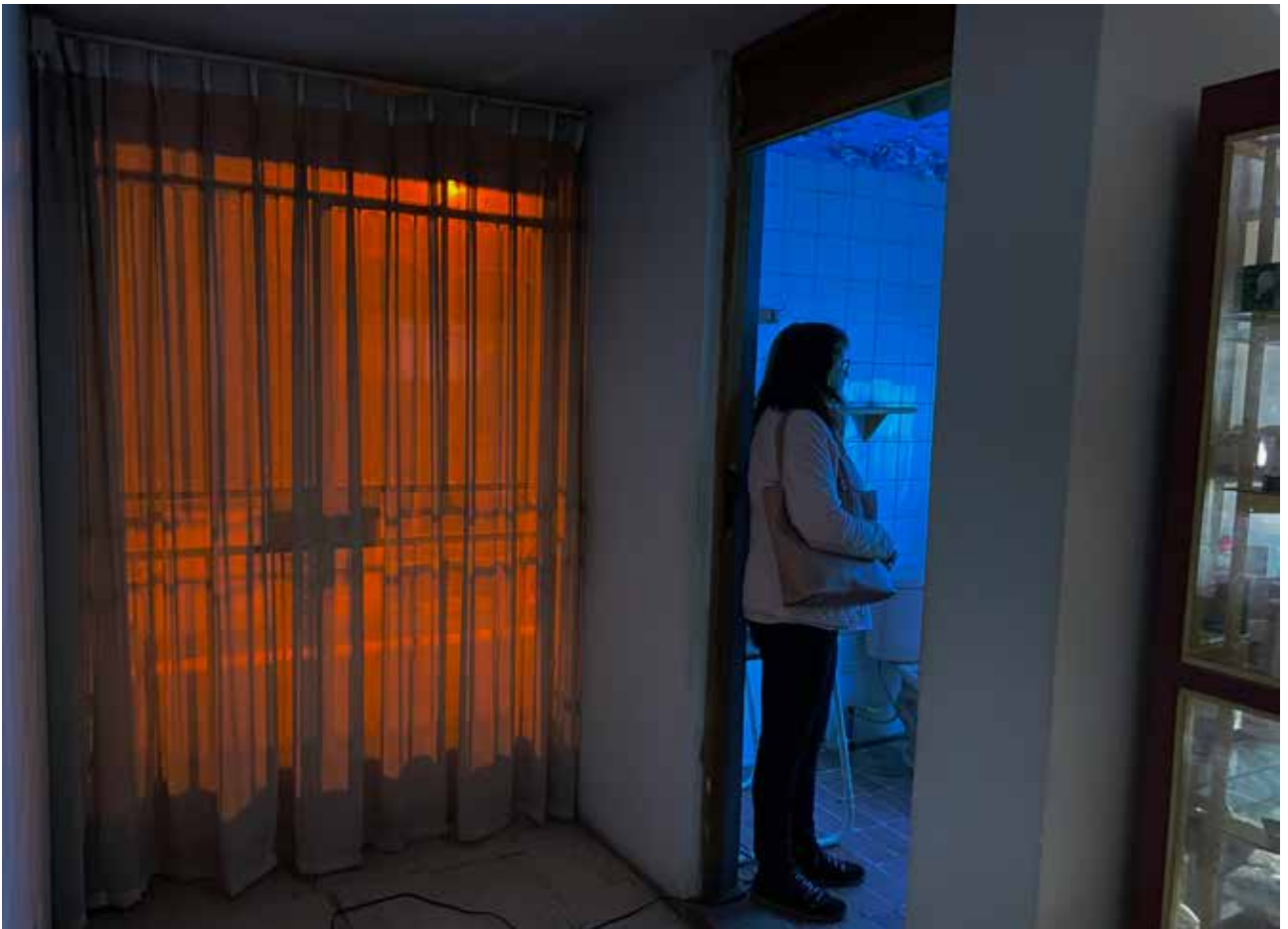
FIGURA 2 Pacheco, S. (2021). Al borde de las cosas [instalación]. Arequipa