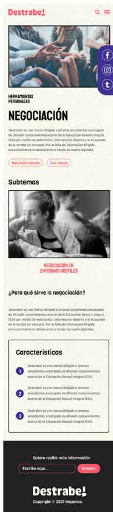
FIGURA 6 Tasayco, D. (2022). Versión mobile de la página web [diseño digital]