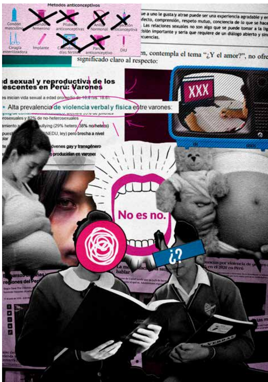
FIGURA 1 Tasayco, D. (2021). Moodboard del concepto [diseño digital]

Cabe resaltar que el desarrollo de la ESI en el Perú dentro de las escuelas públicas se ha visto estancado debido a la falta de material didáctico actualizado y a la carencia de dinámicas o metodologías que guíen al docente para fomentar los valores del área. Tomando en cuenta este contexto, proponemos un recurso que se destaca por ser dinámico y educativo, y que, adicionalmente, permite difundir información actualizada a través de plataformas fácilmente reconocidas por los adolescentes.