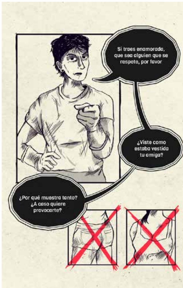
FIGURA 9 Tasayco, D. (2022). Estilo de comunicación en el webcómic [ilustración digital]