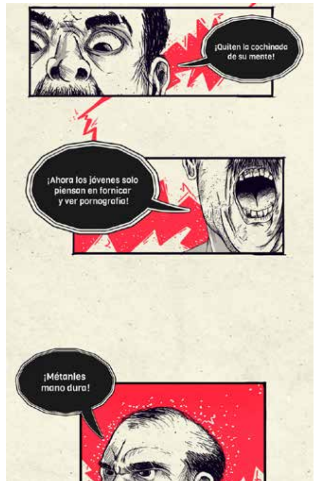
FIGURA 10 Tasayco, D. (2022). Diálogo del primer capítulo del webcómic [ilustración digital]