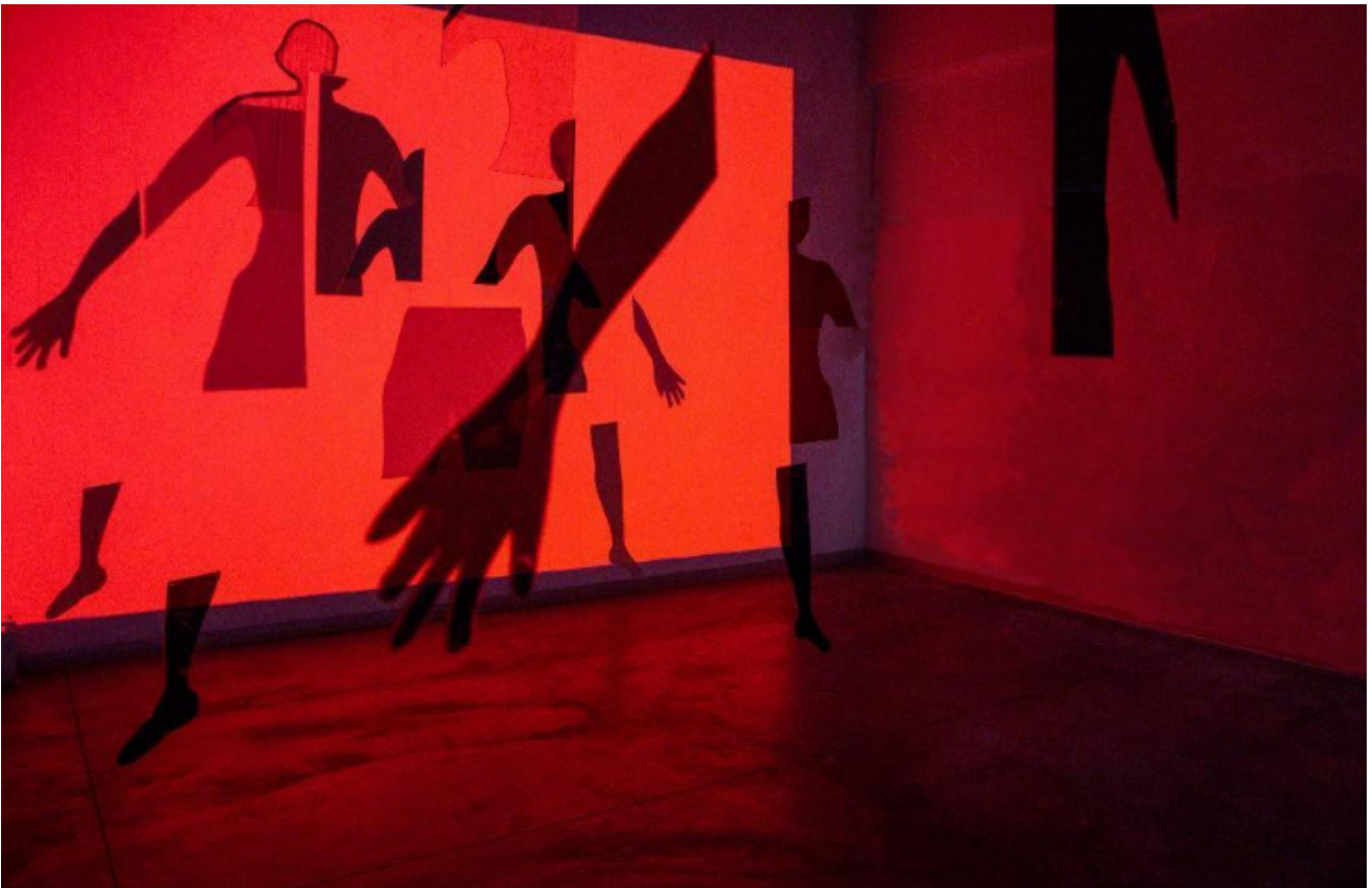
FIGURA 4 Fernández, A. (2021). Siluetas anónimas 1 [acrílico polarizado de tres tonalidades y cortado a láser, medidas variables]