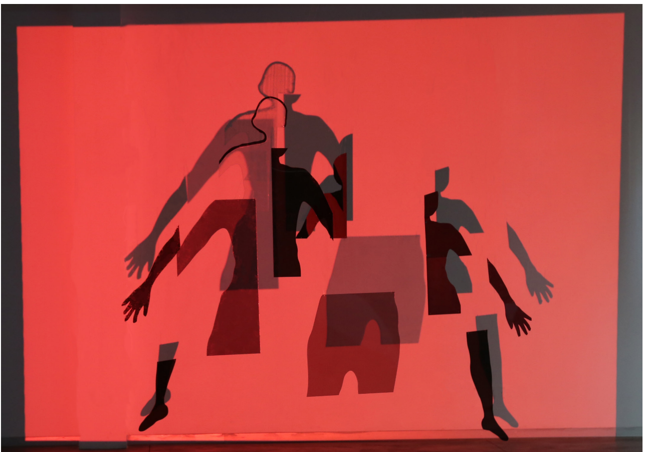
FIGURA 5 Fernández, A. (2021). Siluetas anónimas 2 [instalación]