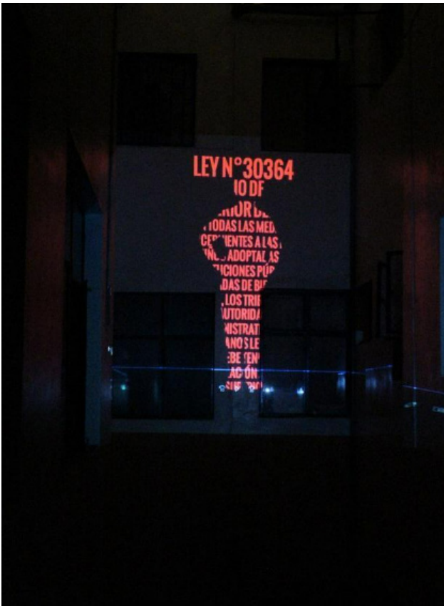
FIGURA 2 Fernández, A. (2021). Silueta 1 (niño y niña) [proyección en espacio doméstico]