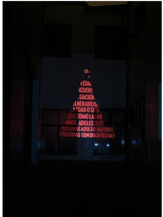
FIGURA 3 Fernández, A. (2021). Silueta 2 (mujeres) [proyección en espacio doméstico]