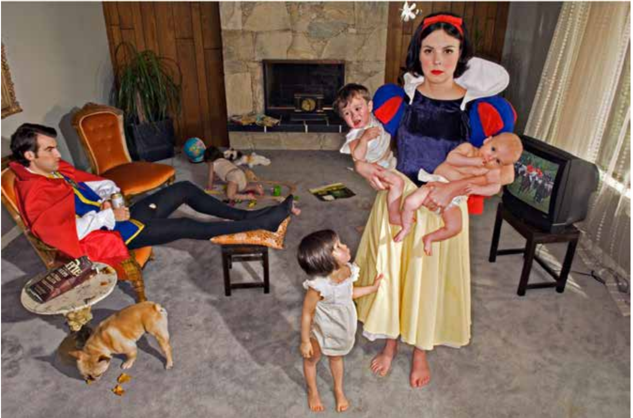
FIGURA 7 Goldstein, D. (2008). Blancanieves [fotografía]

Finalmente, es importante recalcar que los dos primeros enfoques han funcionado en su contexto; sin embargo, es necesario que amplíen su vínculo con otros enfoques. En ese sentido es importante que el docente acepte todos los enfoques como una herramienta para ampliar las mentalidades de los estudiantes y para evitar que se arraigue a uno solo.