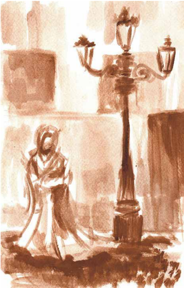
FIGURA 5 Chavez, G. (2018). Tapada sola [dibujo sobre papel]

Este modelo se presenta a principios del siglo XX, cuando el arte se desprendió del modelo académico debido a las consecuencias del pensamiento racionalista que impactó en la pérdida de valores, empatía y honestidad causados por conflictos como las preguerras (Tejeda, 2019). Estos hechos hicieron que los artistas de la época se desligaran del enfoque academicista y propusieran nuevas corrientes artísticas que valoricen las emociones y los sentimientos e incluyeran nuevas técnicas y soportes (figuras 5 y 6).