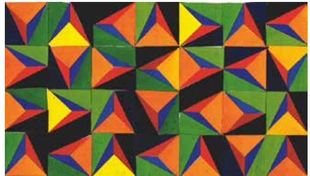
FIGURA 6 Chavez, G. (2015). Movimiento geométrico [collage]