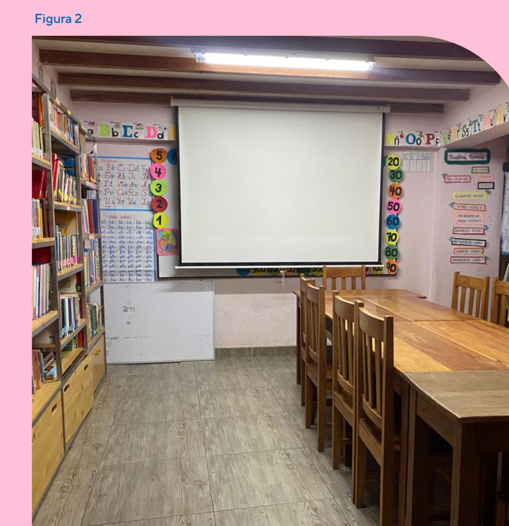
Fotografía propia del interior de la "Casa Mantay"