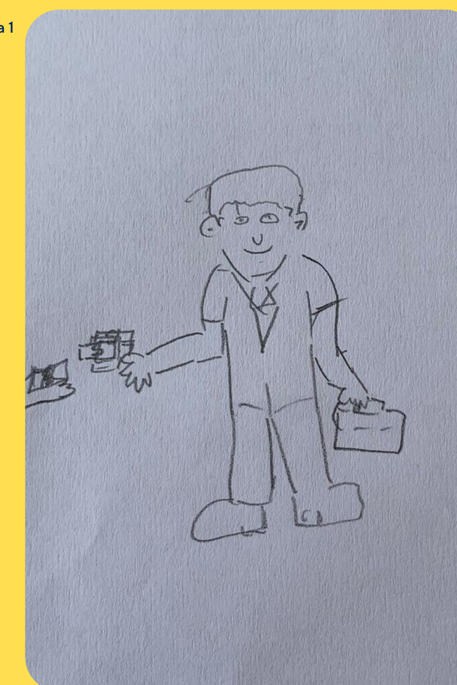
Nota: Representación gráfica del Estado como persona. Elaborado por Mateo, 2023)