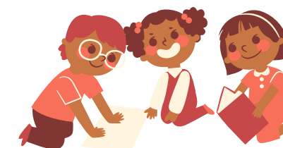
Aula 6to A