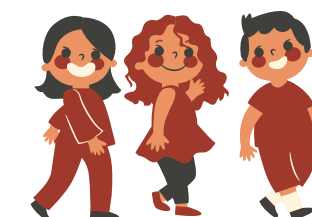
Aula 6to B

Entrevista semiestructurada / Llamada telefonica