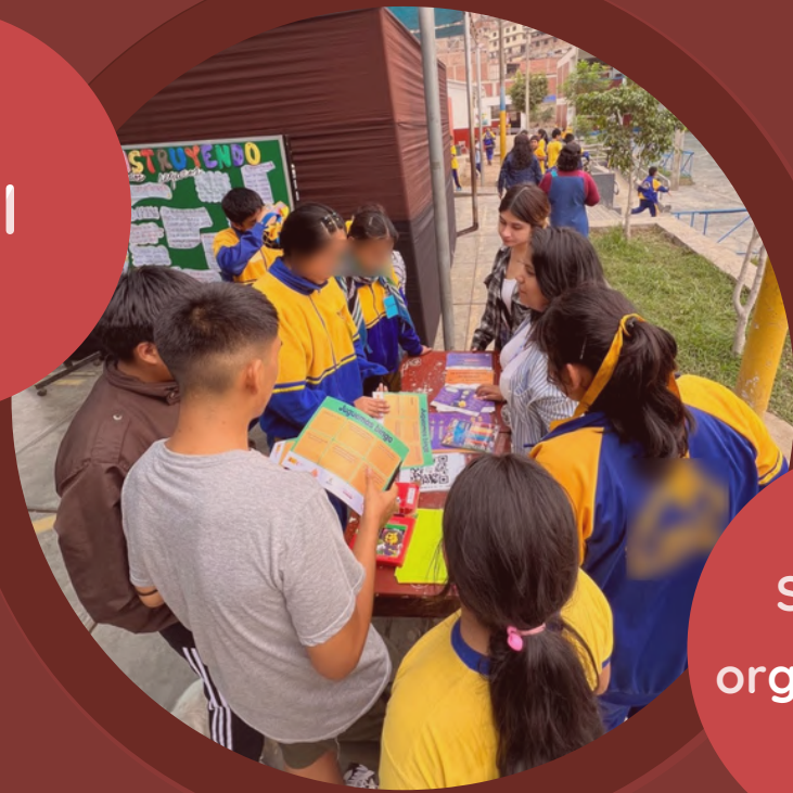
Stands de organizaciones