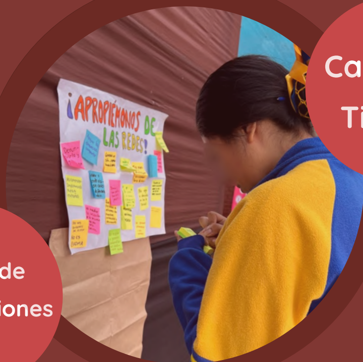
Cabina de Tik toks