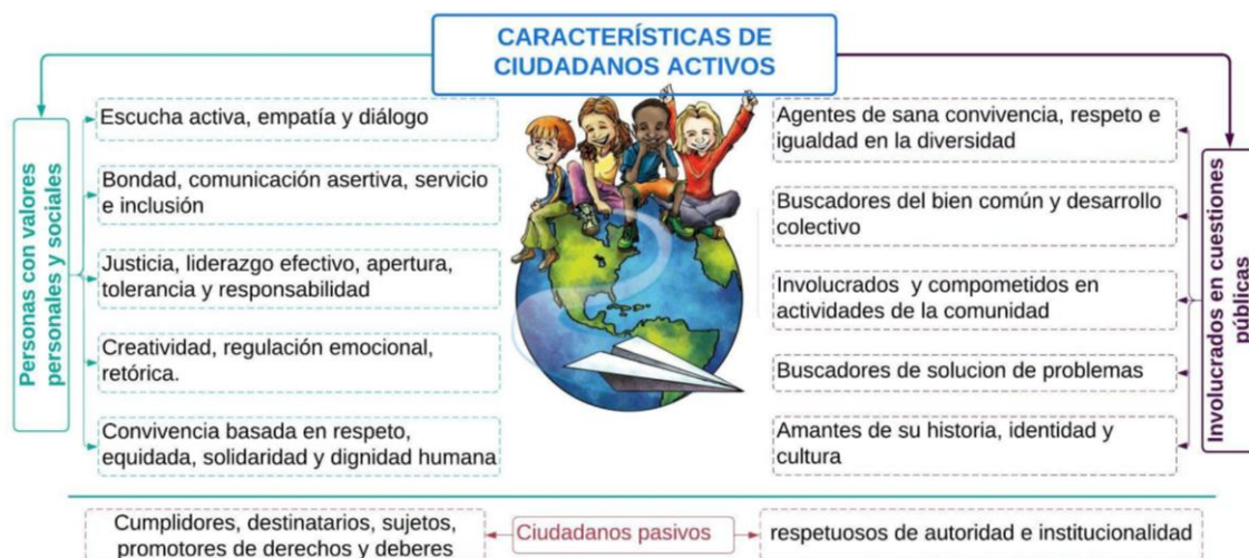
Figura 2: Características de ciudadanos activos

La ciudadanía activa desde la perspectiva del directivo, docente y estudiantes de Amazonas, Perú/ Torres Chavarría, Luis.