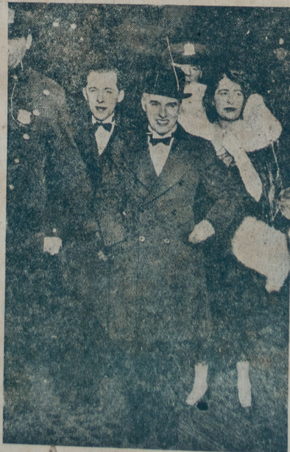
En la noche del estreno en Nueva York de su última producción, "Luces de la ciudad", Carlitos concurre al Teatro