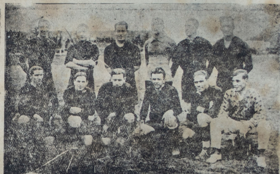
Cuadro del Peñarol que sorprendido por el empuje, de los primeros minutos de juego por Sud América, dejó que su valla cayera dos veces. Su reacción efectiva del segundo tiempo, dejó la impresión de que su mala suerte fué el factor de la derrota.

vincias que nunca han visto actuar a los buenos equipos extranjeros que han visitado la capital, hayan podido reflejar en la práctica hasta condiciones de que carecen los de la capital, como son rapidez y remate.