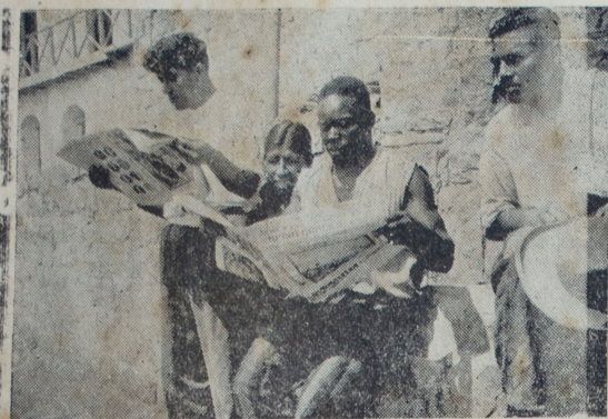
"SPORT GRAFICO" se lee en todas partes, apareciendo en esta fotografía los reclusos de "El Frontón"