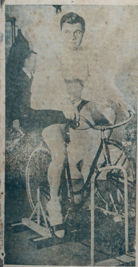
Babe Ruth, haciendo pedales, uno de los entrenamientos, al que concede gran importancia en su acondicionamiento físico, para la próxima temporada basebolera