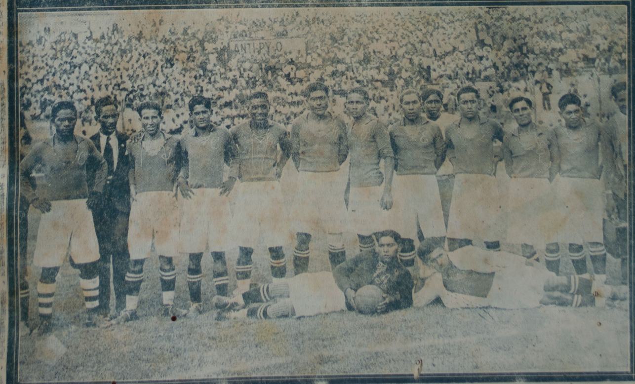
El equipo de la Universidad que venció por seis goals a cuatro al "Jorge Chávez" de Ica, que también ilustra nuestra portada, y que mañana se enfrentará al Alianza Lima en un match que promete ser interesante.