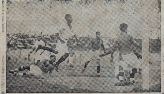
Instante en que los iqueños colocan un goal al Alianza Frigorífico Nacional

Cabe criticarle a Denegri, sin embargo, no precisamente la impetuosidad de su juego, sino los fouls que intencionalmente comete quizá con ánimo de amedrentar a sus adversarios, forma en que perjudica a su equipo material y moralmente, por-