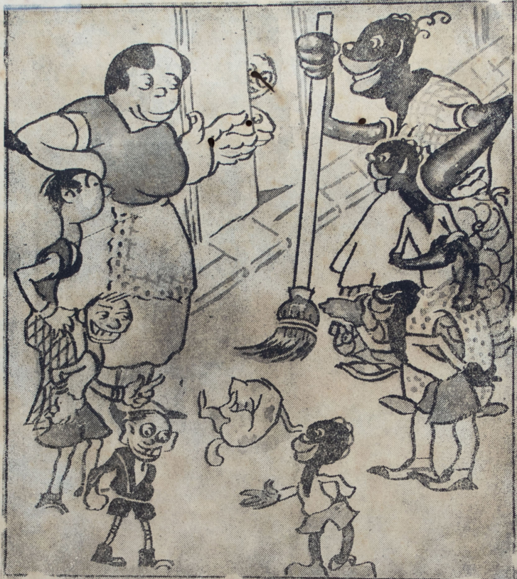
Dos familias contricantes que también riñeron antes...