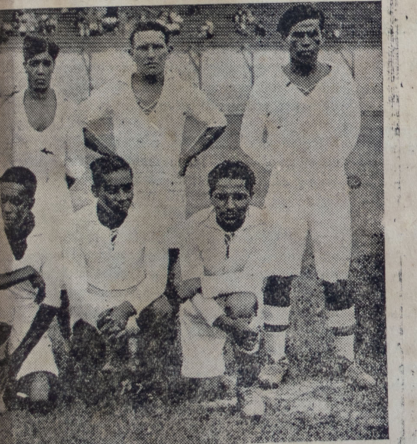
que empató con el "Jorge Chávez" de Ica

na falsa salida del tido en el mejor queño, por sus entes incursiones, por su ala que cul- vo centro preciso delantero centro có así el segun- el cuadro visitan-