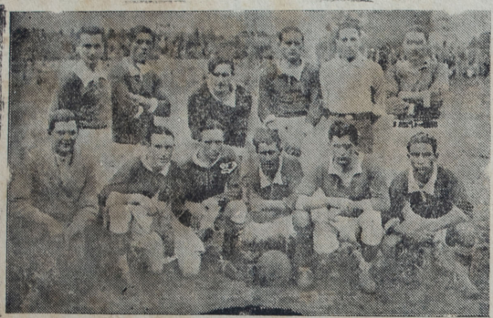
Cuadro del "Defensor" que ante Nacional mereció, por el brillante juego desarrollado, dividir honores, no obstante lo cual cayó vencido por su rival por 2 a 1

ción aparte del comentario que nos ha merecido la actuación del equipo iqueño, y que publicamos en otro lugar de esta edición.