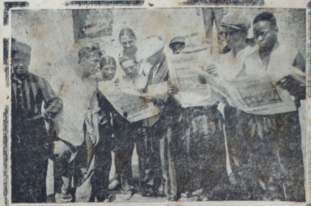
Grupo de reclusos de "El Frontón" leyendo "SPORT GRAFICO", con lo que demuestran su afición al deporte