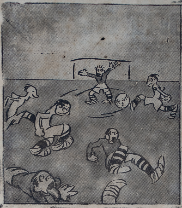
Cuando juegan los iqueños lo hacen sin gran alarde, "arrepujan" los triguieños y el campo parece que arde.