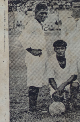
El equipo del Alianza Frigorífico Nacional

El equipo iqueño jugó mejor fútbol que en su match anterior, y quizá no nos equivoquemos al decir que actuó con mayor entusiasmo.