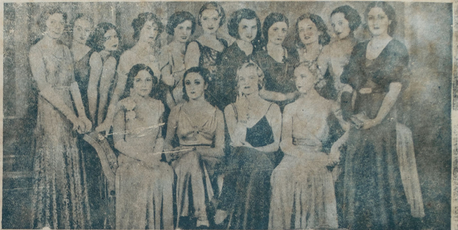
Las bellezas europeas y Miss Argentina y Miss Perú, reunidas en Niza, el día en que fué proclamada Miss Europa, 1932.