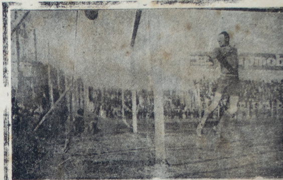
El primer goal hecho por Defensor en el segundo tiempo, efectuado por Podestá de la línea livera de los violetas que premió la mejor labor desarrollada por este cuadro, en este tiempo.

Para esto es indispensable la protección del gobierno, traducida en la acción del parlamento, en el sentido de señalar los