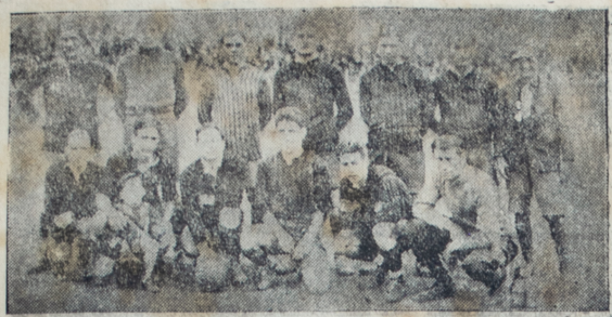
Cuadro del Sud América que dió el gran campanaso, venciendo al cuadro de Peñarol por 2 a 0