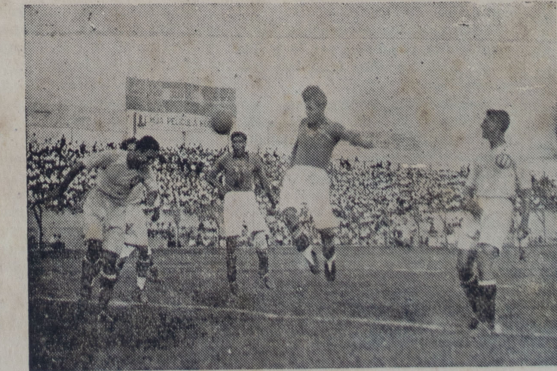
Una escena del match de la Universidad vs. "Jorge Chávez" de Ica

Impresionó bien el cuadro de Ica por su juego veloz y buen remate, aparte de las condiciones que dejamos ya descritas, mereciendo ver coronados sus esfuerzos con el triunfo.