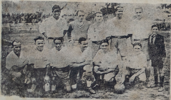
Cuadro del Nacional que con más suerte en los remates finales, venció a Defensor por 2 a 1 después de haber capeado victoriosamente los momentos difíciles planteados por su poderoso rival.

fica todo triunfo atlético nacional. No podemos imaginarnos a Dickens dirigiendo un team adversario, porque es una prueba viviente de la extraordinaria captación de nuestro medio. Lo hemos visto entusiasmarse y emocionarse como argentino, y lo vemos ahora ocultando una honda amargura tras la pasiva resignación de su disciplina sajona.