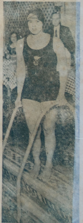
Gertrude Ederle, la famosa nadadora norteamericana