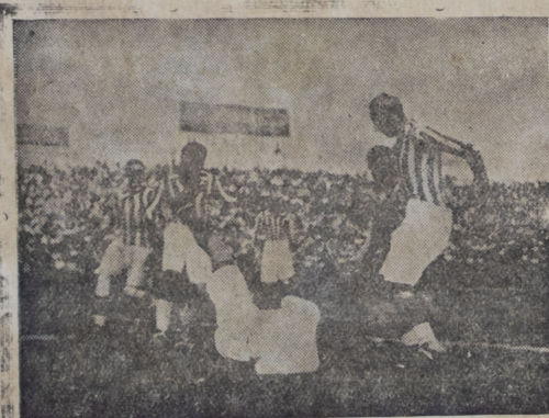
Otero en una espectacular salva da

Después de estos dos goals los jugadores del A. Lima, actuaron ya a la defensiva solamente, en el deseo quizá de evitar una goleada, y faltando unos quince minutos para la terminación del match los jugadores del combinado chalaco se concretaron a "camotear" a sus adversarios. No había ya la menor esperanza