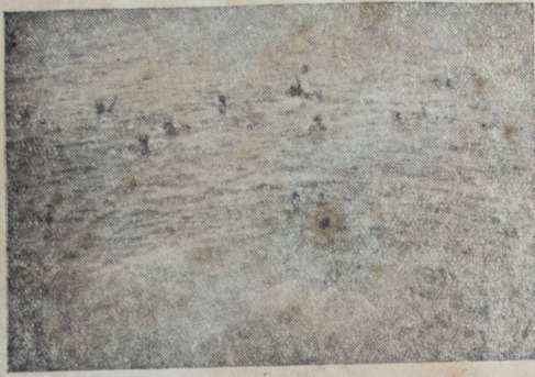
Los equipos de water polo de la Y. M. C. A. y del "Adán del Río" de la Colonia Penal de El Frontón.