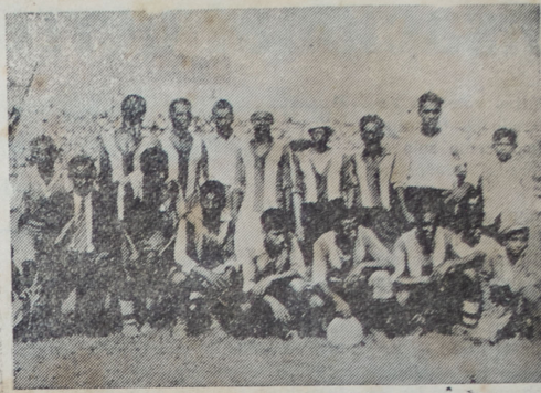
El cuadro de reserva de primera del Alianza Lima, que venció al de igual clase del Atlético Chalaco.

Yo creo que, dada la animosidad reinante en las altas esferas deportivas contra el Callao, a quien en la formación de la Liga ha sido abandonado a sus propias fuerzas, sin