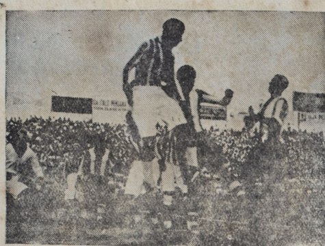
Una entrevero frente a la valla del Atlético Chalaco