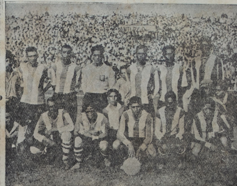
Jugadores que integraron el domingo el equipo del Alianza Lima, que fueron ampliamente derrotados por el Combinado Chalaco.

Publicamos a continuación el boletín de la Federación Peruana de Fútbol, en que se indican los encuentros preliminares y los precios señalados para el espectáculo de hoy y el de mañana.