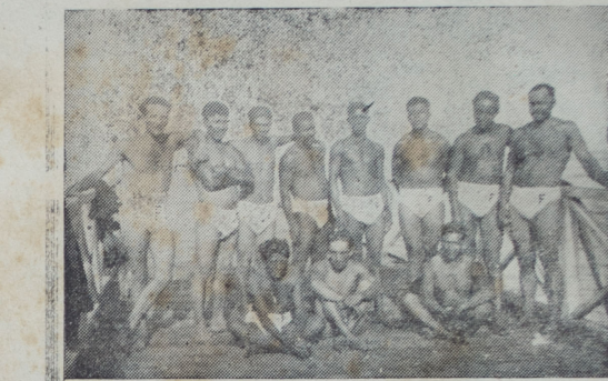
Equipo de natación y water polo del "Adán del Río" de la Colonia Penal de El Frontón.

só a la Argentina, cosechando los aplausos de sus compatriotas, para retornar de nuevo a los Estados Unidos en busca de la faja mundial.