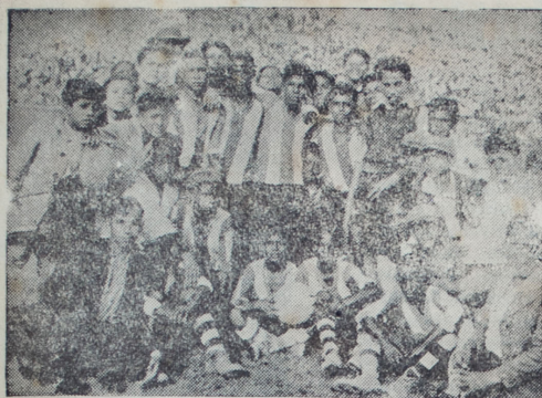
El equipo infantil del Alianza Lima que venció al de igual categoría del Atlético Chalaco.