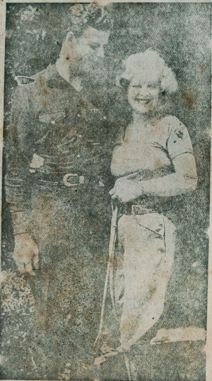
CLARA BOW y REX BELL, dos estrellas de fama en Hollywood, tomando "aire" después del "calorcito" de los "prados cinematográficos"