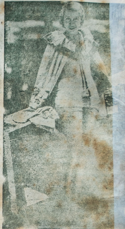
ANITA PAGE, la vampira de las sonrisas, luciendo una bella capa que ella denomina "del amor"