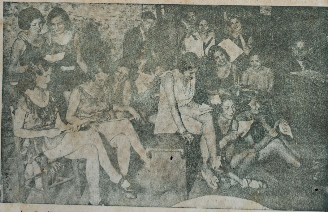
Los "preliminares" de una revista en preparación. Las chicas del cuerpo de baile ensayan un cuplé que el maestro "pasa" al piano