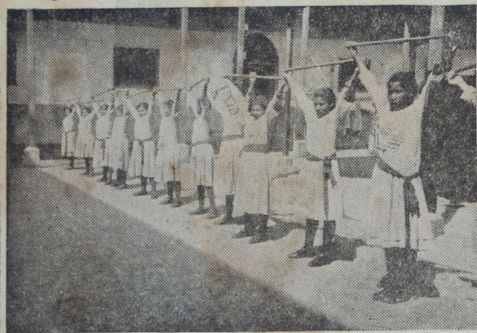
Alumnas del Colegio Correccional de Santo Tomás, ejecutando una figura de la gimnasia, con bastones.