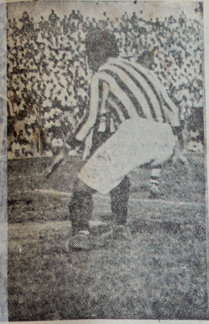
Machado y Puente se disponían a rematar.

Nuevamente tendrán los aficionados de esta capital oportunidad de ver jugar a los futbolistas de Ica, cuya actuación en el campeonato nacional realizado en 1928 aun se recuerda.