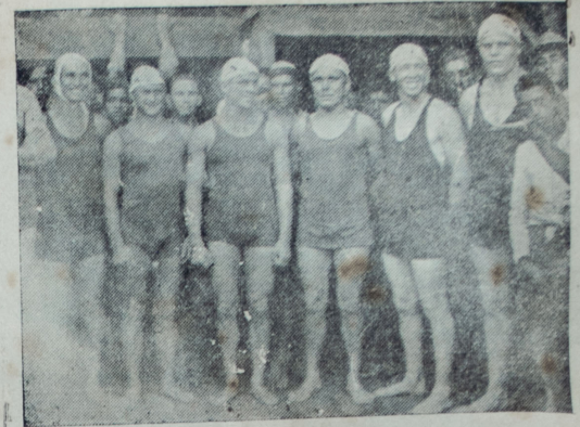
Equipo de waterpolo de los cruceros ingleses que perdió frente al Old Boys Club

Al referee Lazo, ayer se le permitió ser vivo y en algunas oportunidades, falló en forma equivocada. A las 209