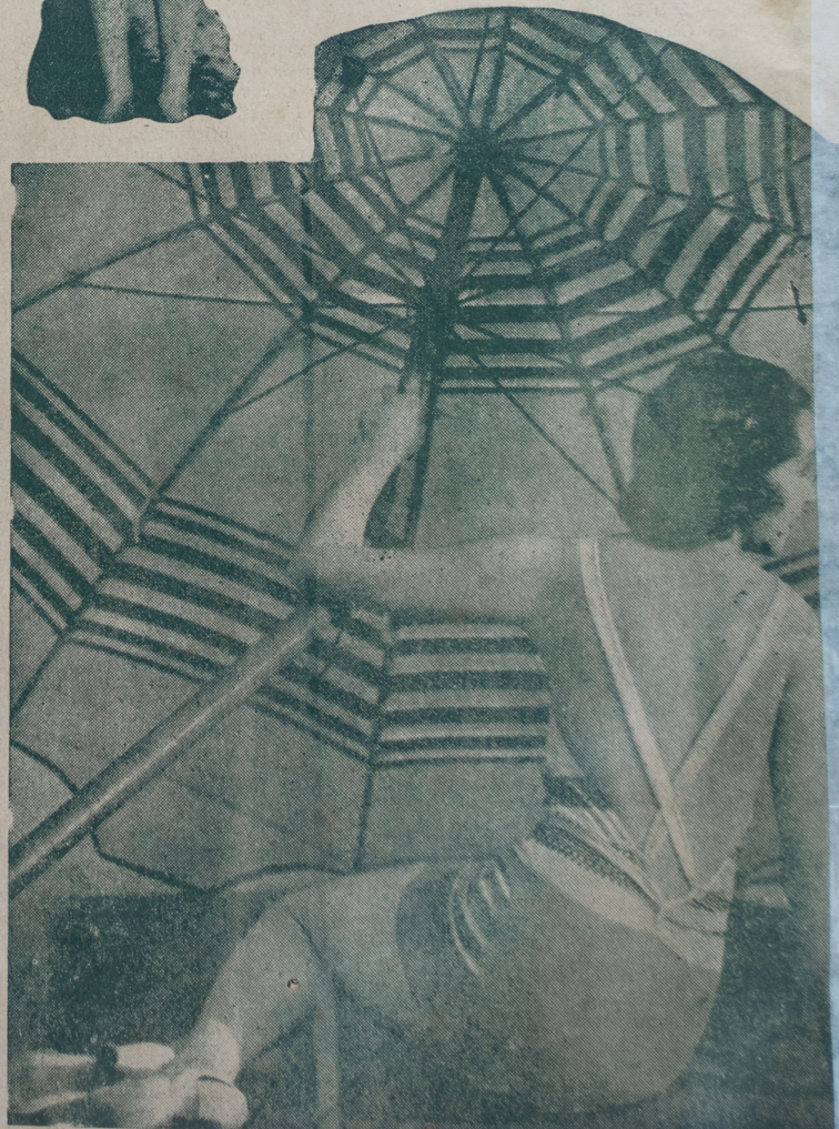
Vistoso traje de jersey