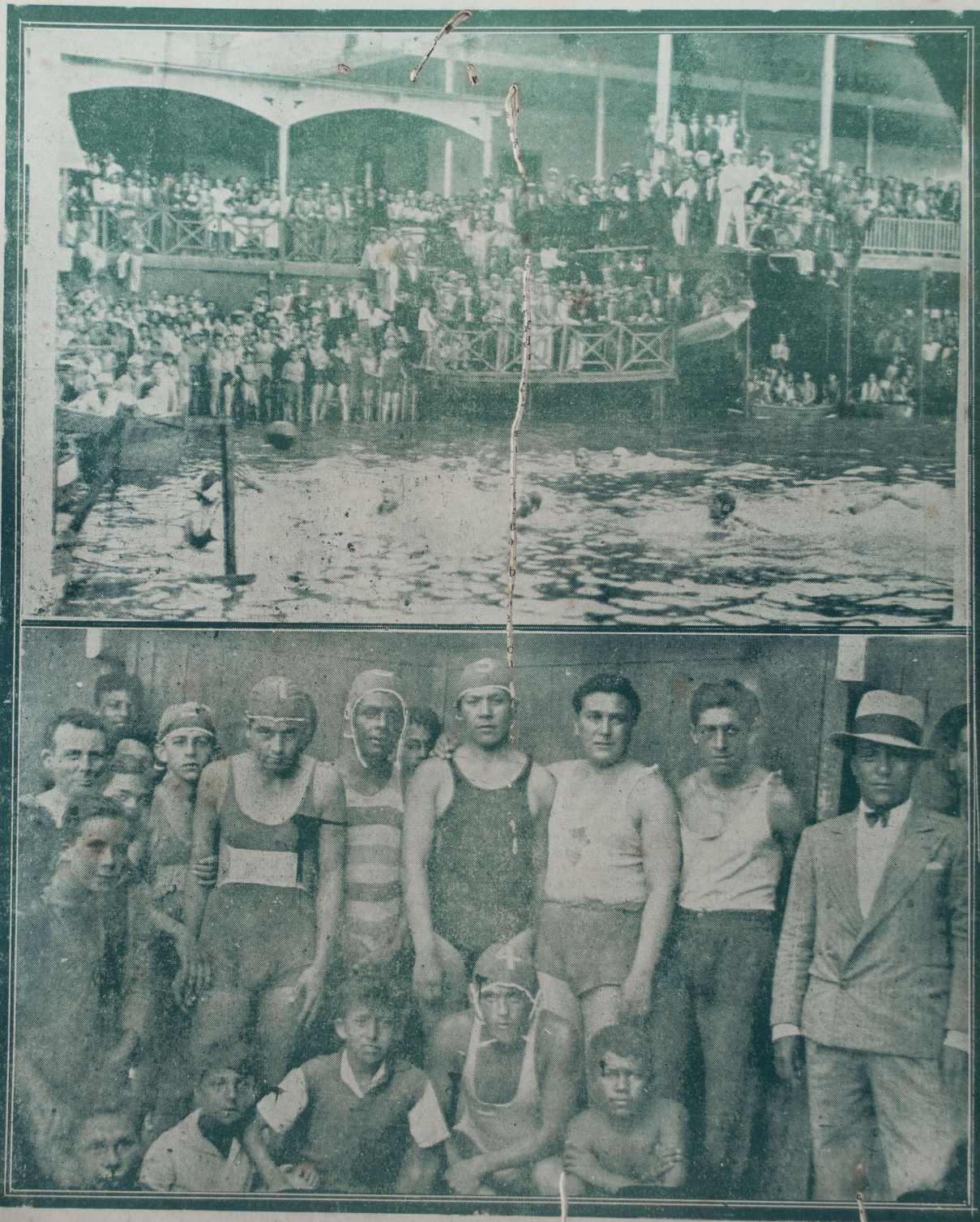
Interesante escena del match de water polo que jugaron los equipos del Old Boys Club y de los cruceros ingleses "Durban" y "Dountless", el cual fué presenciado por la numerosa concurrencia que se ve en las terrazas del Club Regatas Unión, y el cuadro vencedor.