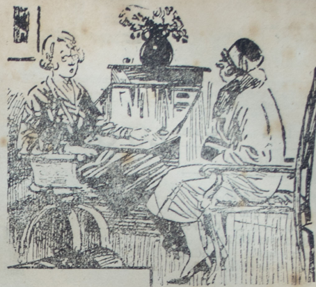
La dueño de casa. — Usted me ha dicho que abandonó su última ocupación porque toda la familia salió de la casa. ¿A dónde se fué?

Lo que creamos que no merecen es lucirse por las calles como lo viene