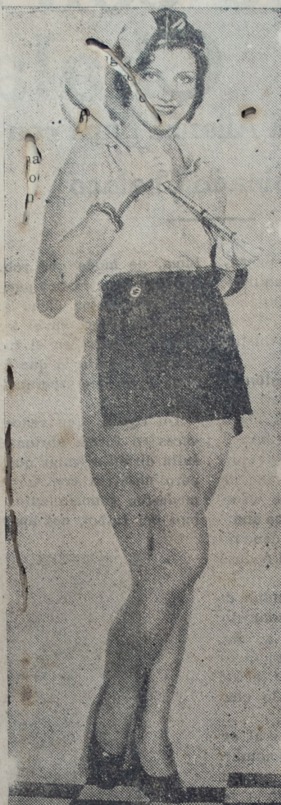
Peggy Shannon lista para dar una vuelta alrededor del mundo si sólo tuviera quien la acompañara

para comprender qué intensa energía pone Joan en cuanto hace... en su trabajo, en sus partidas de tenis, en el cuidado de su hogar. Fué esta energía lo que hizo que se la eligiera de entre un coro de tiples de Chicago para ofrecerle un contrato cinematográfico; y que más tarde la llevó, de los papeles de extra, a los de primera dama, y finalmente a la consagración como estrella, en un período de tiempo asombrosamente corto.