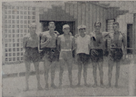
Otra de las tripulaciones vencedoras de las regatas del domingo.