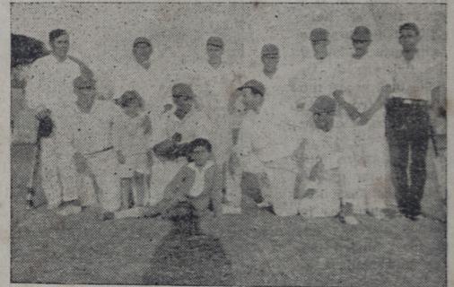
Equipos de cricket del Sáenz Peña que venció el sábado pasado al formado por los tripulantes de los cruceros ingleses.

En los juegos olímpicos de 1912, realizados en Stoccolmo se hizo ya posible perfilar la marcha futura de los acontecimientos. Gracias a Meredith, los Estados Unidos conservaron la primacía en los 800 metros, pero por lo que se refiere a los mil quinientos, tuvieron que resignarse a presenciar cómo el británico Jackson arrebataba la palma al norteamericano Sheppard. Y a partir de entonces, perdieron asimismo en los ochocientos metros.