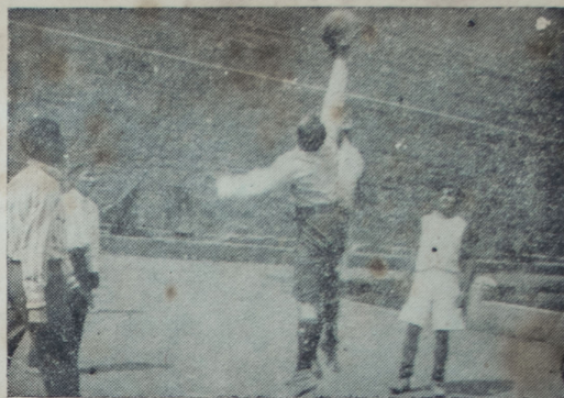
Escena del match de basket ball realizado entre los equipos del Banco Italiano y del Panóptico

Insistimos y continuaremos haciéndolo en que es preciso derogar el gravamen municipal que pesa sobre el deporte, y que su producto se aplique a la protección de las instituciones que lo cultivan, la mayoría de las cuales se encuentran desamparadas y sin recursos.