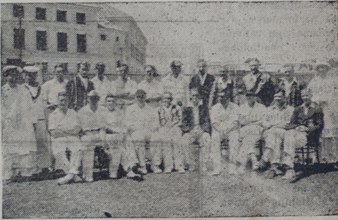
Equipos del Lima cricket y de los cruceros ingleses, antes del match que jugaron el domingo que terminó con el triunfo de los nuestros

Los entrenadores franceses emplean desde hace ya muchos años los baños de vapor. En 1912 y 1913, Jean Bouin lograba en los Juegos Olímpicos de Stoccolmo dominar en los 5,000 metros al primer gran campeón finlandés Kolhemaineg y atribuirse por consiguiente los records mundiales de la media hora y la hora. Y Bouin asignaba a los baños de vapor y los masajes el mérito principal de sus triunfos. Ladoumégue, por su parte, cuida más de mantener la