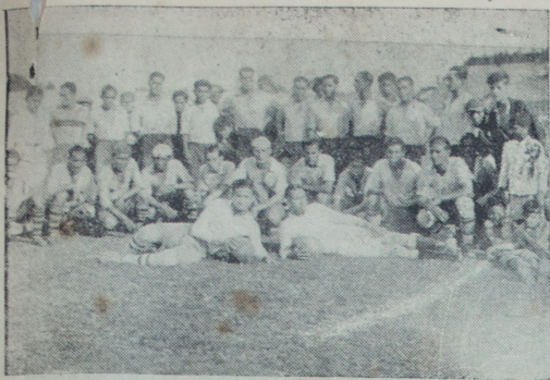
Los equipos Boca Juniors y San Carlos que jugaron el domingo en el Estadio Modelo, venciendo el Boca.