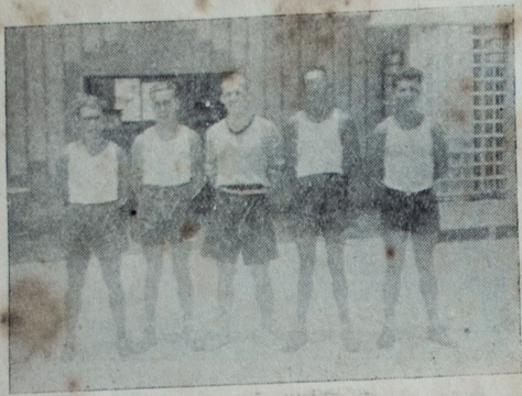
Triputación vencedora en las regatas del domingo que organizó el Club Lima de Chorrillos

(De "El Pueblo" de Arequipa del 29 de febrero)