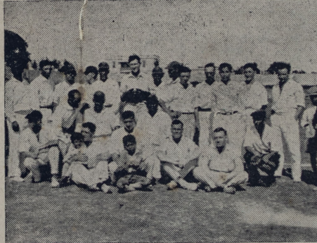
Jugadores del Lima Cricket y del Sáenz Peña que compitieron el miércoles sin definir el match por la falta de luz.