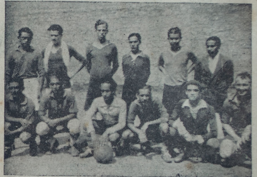
Cuadro del Banco Italiano que venció al team del Panóptico por cuatro goals a uno

Los footballers españoles aparecieron de nuevo en los juegos olímpicos que se disputaron en París en el año 1924, pero el equipo italiano lo venció en el primer tiempo por 1 a 0. Siguió para ellos una larga serie de éxitos internacionales, pero los italianos los vencieron de nuevo en Bolonia en el año 1927. Al año siguiente, España participó en los juegos olímpicos que se disputaron en Amsterdam, y su equipo de footballers empezó en forma brillante al vencer a Méjico en la primera rueda por 7 a 1. Una vez más se midieron con los italianos, empatando con e.