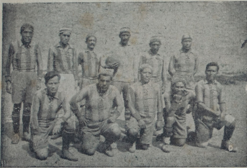
Jugadores reclusos del Panóptico que jugaron el domingo pasado con el equipo del Banco Italiano

zo un gran esfuerzo por tratar de alcanzar la pelota.