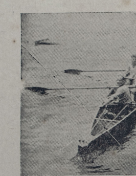
Nota gráfica de las regatas del domingo

mente, a título de subvención a los atletas que irán a los Estados Unidos este año. Esto, a pesar de la crisis. Los suecos enviarán una representación digna de su tradición atlética, tanto a Los Angeles como Lake Placid.