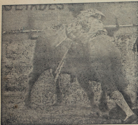
Facultades mojado hasta el puño.

Los precios para ésta corrida, no obstante que se trata de una corrida de toros y no una novillada, serán los mismos que se han cobrado hasta ahora, es decir, cuatro soles en sombra y dos en sol. No cabe más equidad en los precios y bien podemos decir, sin lugar a equivo-