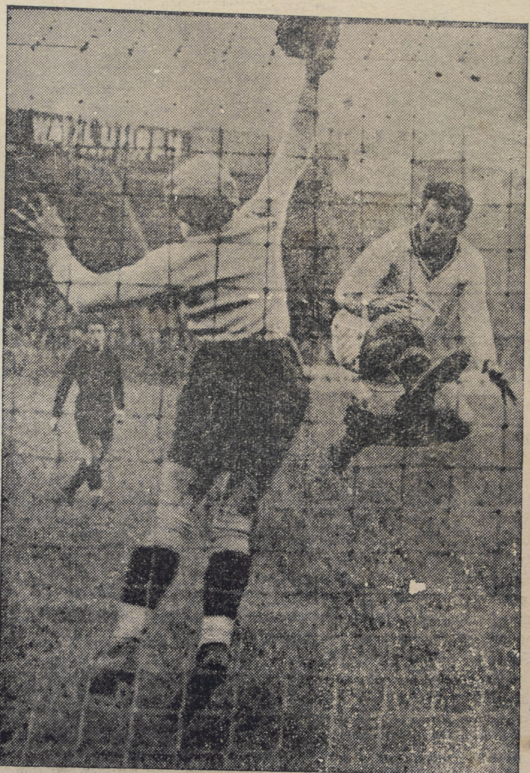
Hidden arquero que defendió los colores de Austria frente a Suiza, en una partida.

Después de interesantes incidencias presenciadas por un público muy nu-