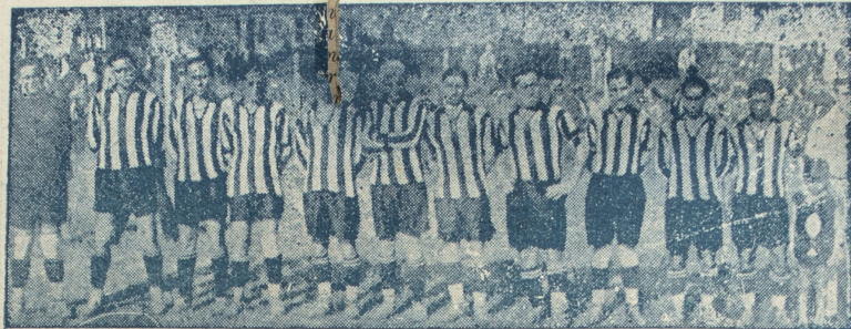
Equipo Wanderers que se ha clasificado campeón uruguayo de 1931.