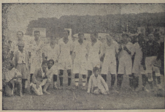
Equipo del Frigorífico

Stadium Nacional. Partido final del torneo organizado para disputar la "Copa Uruguay". Partido amistoso entre equipos infantiles.