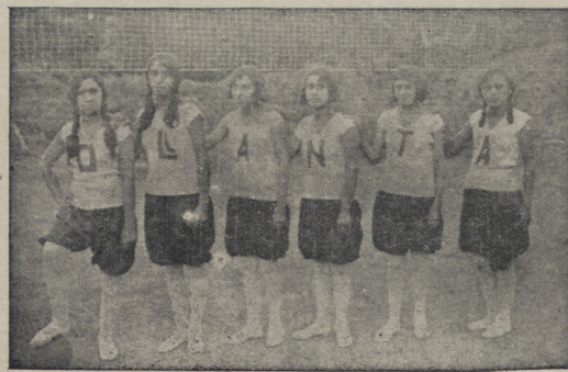
Cuadro A. del Centro Deportivo "Ollanta"

El miércoles 6 del pte. se realizó un interesante match de Volley Ball en el Stadium del Colegio Nacional de Minería, entre los primeros cuadros de las prestigiosas entidades femeninas del "Ollanta" y "Diana". Con este motivo horas antes de que comenzara el juego numeroso público de todas las categorías sociales acudió como pocas veces al campo, ávidos de apreciar la superioridad de uno de los dos equipos contendores.