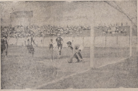
Escena del interesante match del Domingo entre los equipos infantiles del Alianza Lima y K. D. T.

la tarde anterior, si juego más armónico le hizo anotarse dos tantos. El Noroeste por su parte hizo también un match aceptable. Mejoraron con la inclusión de Reyes Morán y Rosel, el cuadro ferroviario parece que volverá por sus fueros. Un poco de más entrenamiento y este equipo conseguirá ser la atracción de otra reciente época. A rana fué batido dos veces con tiros atajables; pero que por el afán de lucirse se les escaparon. Menos mal que el Noroeste consiguió también 2 goles, uno en el primer tiempo y otro en el segundo. En general el juego fué correcto e interesante.