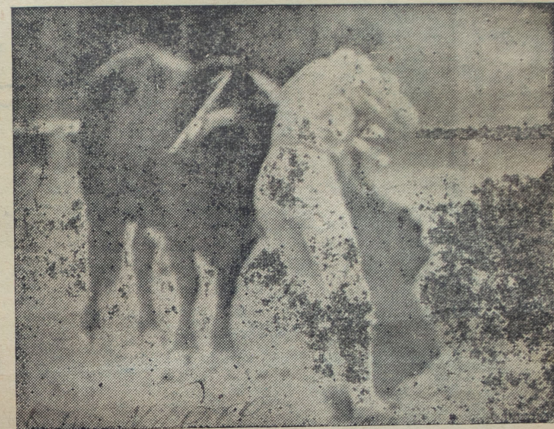
Facultades yendo por uvas