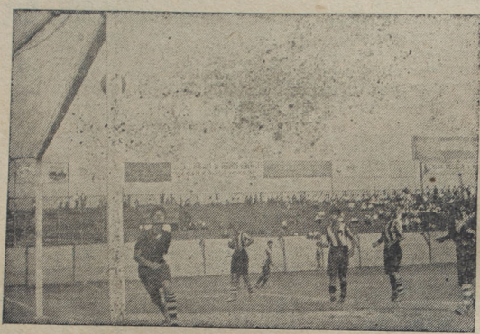
Infantiles del Alianza Lima y Sportivo Unión