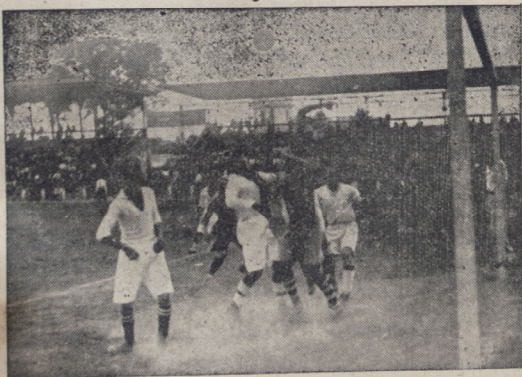
Momento de apremio creado a la valla del rigorífico

pie en la forma descrita, habrá dominado un punto relacionado con el arte de correr, al que tan poca atención se otorga entre nosotros. El correcto porte para la carrera corta requiere una inclinación de todo el cuerpo a un grado que permita la exacta suma de tracción e impulso. Sin este porte el cuerpo no se puede obtener el completo impulso hacia adelante. La inclinación del cuerpo tiene que ser lo suficientemente pronun-