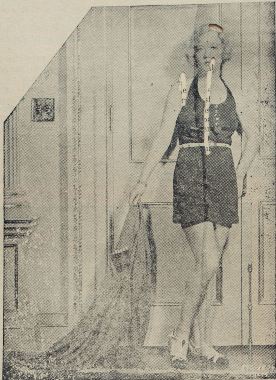
¿Conoce usted a esta artista?