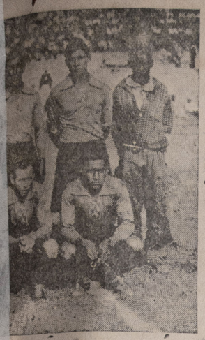
ganar la Copa Uruguay.