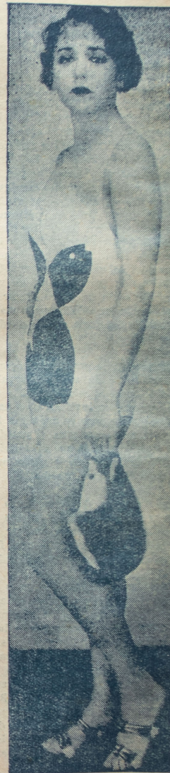
Bebe Daniels una estrella de Warner Bros