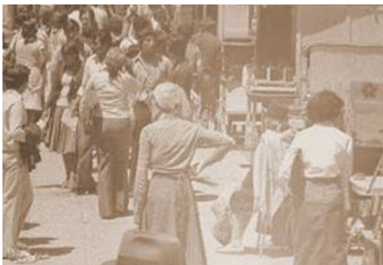
Figura 5. El Cofresito, fotografía de la Feria popular en la Avenida 24 de mayo , 2017. https://elcofresito.blogspot.com/2017/09/historia-de-la-avenida-24-de-mayo-quito.html