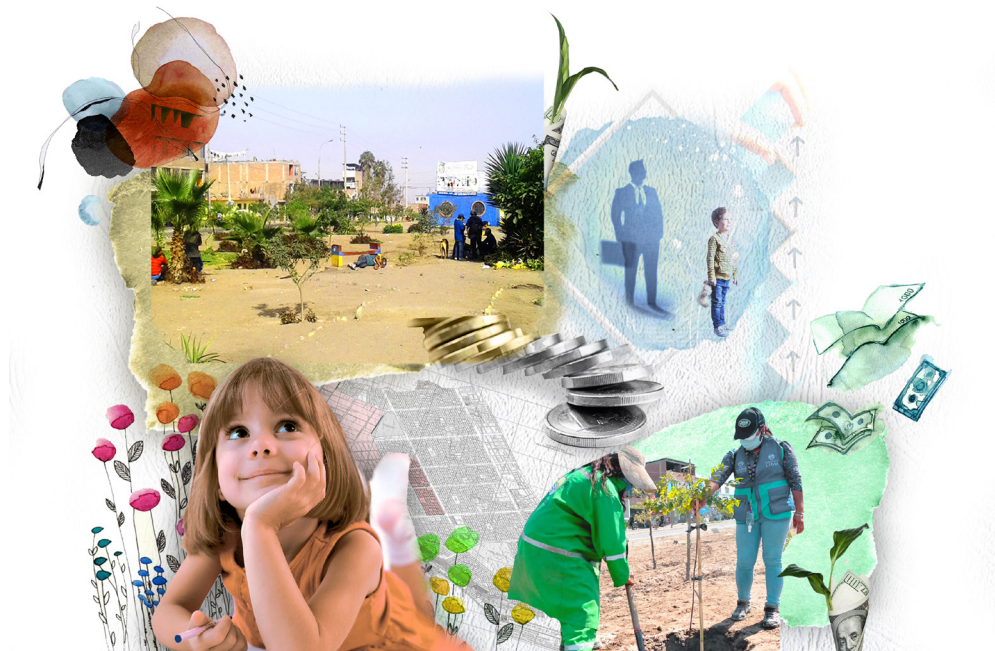
Figura 1. Moodboard del concepto. Elaboración propia.