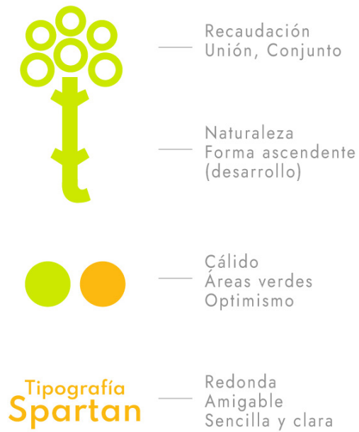
Figura 4. Construcción de logotipo. Elaboración propia.