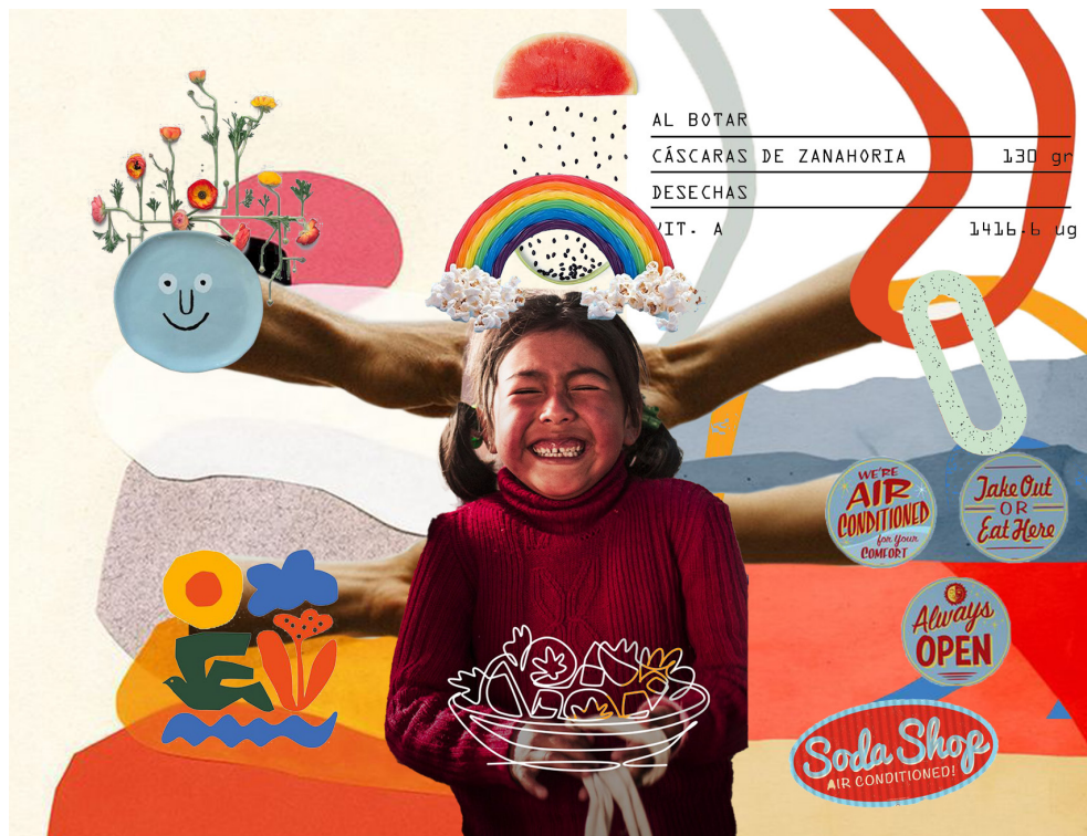
Figura 1. Moodboard del concepto. Elaboración propia