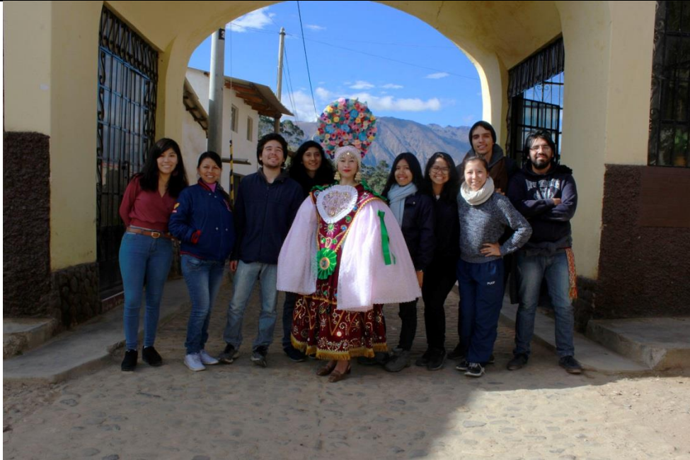
Foto de Archivo (Por Talia Trujillano): Viaje de investigación a la fiesta de San Pedro de Corongo - 2019

Boletín del área de investigación y proyección social del CEMDUC - Centro de Música y Danzas de la Universidad Católica