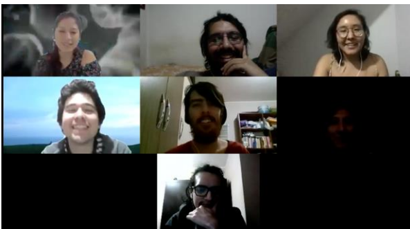
Imagen correspondiente a la segunda reunión de coordinación del núcleo de investigación en el año 2020

Con el inicio de la emergencia sanitaria, la propuesta para crear este espacio tuvo que ser trasladada a la virtualidad. Es así que, en marzo de 2020, se convoca a un grupo de miembros de los entonces cuatro elencos del CEMDUC para, de manera conjunta, discutir y dar pie a lo que convertiría en el núcleo de investigación. De esta forma, con la participación de los miembros del grupo, se establecen los objetivos y la línea temática del núcleo, la cual giraría en torno a explorar los sentidos de tradición e identidad en la música y las danzas peruanas, siempre con miras a complementarlo con la labor artística y académica del CEMDUC. Por otro lado, el núcleo de investigación se consolidó como un espacio de discusión y reflexión sobre diversos temas relacionados a la música y la danza, así como a la práctica de los miembros como parte del CEMDUC.