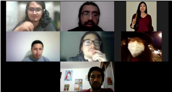
Imagen correspondiente a la última sesión de discusión del núcleo de investigación del año 2021

sobre temas específicos que se habían venido realizando. También resalta la participación de el núcleo de investigación en la última tertulia del año 2021, titulada “Hacer investigación en el CEMDUC” así como la elaboración de un video memoria, pensado a publicarse en las redes oficiales del CEMDUC, y que estaría completo a inicios del año 2022.