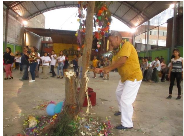
Persona intentando derribar el monte mientras el resto baila alrededor.

Es de resaltar también que la mayoría de las reflexiones de los participantes se dieron en relación a comparar la experiencia con la obtenida en el viaje de investigación realizado por el CEMDUC en el año 2018, a la localidad de El Carmen, para presenciar la tradición de la “Yunza Negra” organizada por la familia Ballumbrosio. Esto se dio en tanto que muchos de los miembros del grupo que viajaron en aquella ocasión también participaron de esta salida de campo. Esta experiencia les permitió a los participantes generar varias reflexiones relacionadas al sincretismo cultural entre dos espacios culturales que son usualmente vistos como separados, remarcando que los elementos centrales de ambas celebraciones tienen raíces muy similares, y que el dialogo cultural entre la costa y la sierra reflejado en sus tradiciones musicales, ha estado siempre presente, contrario a lo que comúnmente se cree.