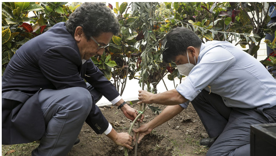
Árbol plantado en el jardín de la facultad de Estudios Generales Letras

Como producto de dichas reuniones se definió la actividad a la cual nombramos “Ruta de la Memoria por la COVID-19”. Este nombre alude tanto a la estructura de la actividad como a lo que ésta evoca. En términos de lo que esta actividad evoca, se decidió pensarla como un camino conjunto y colectivo por el recuerdo, que nos permitiera conmemorar a aquellas personas que perdimos por la COVID-19, que permita transitar y desplazarse por el recuerdo de todos aquellos seres queridos que perdimos. Así, la ruta evocaba la idea de una procesión o peregrinaje vivido en comunidad.