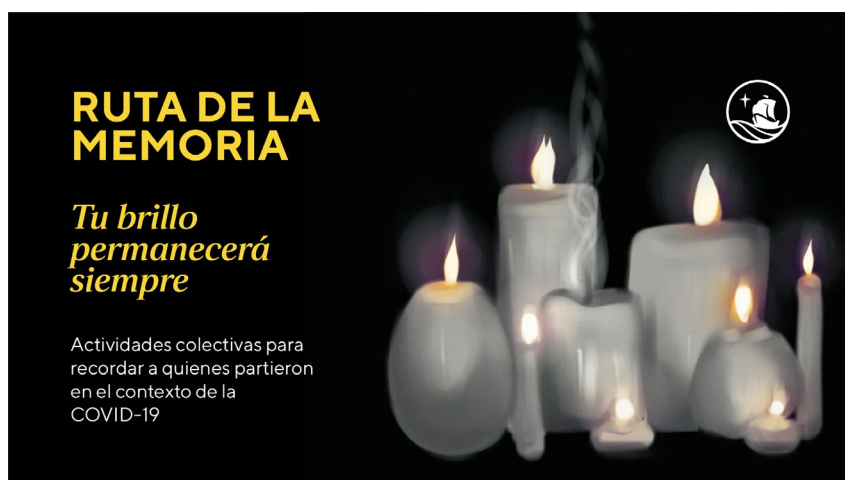
Arte oficial para la difusión de la "Ruta de la Memoria"