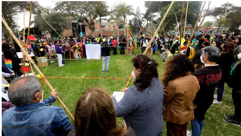
Encuentro y recepción de urnas

El tema del duelo fue acogido con entusiasmo, respeto por la diversidad y cuidado por todos y todos los miembros de la comunidad PUCP que participaron. La participación activa, consistente y generosa de las unidades que gestaron la Ruta de la Memoria por la COVID-19 fue inspiradora y fue, en sí misma, un espacio que fomentó el sentido de comunidad. El apoyo de distintas instancias institucionales como la DCI y la DAES, con enorme disposición y creatividad, fueron también invaluable. La participación más amplia de la comunidad PUCP en la semana y día central fue también muy activa, cuidadosa y generosa.