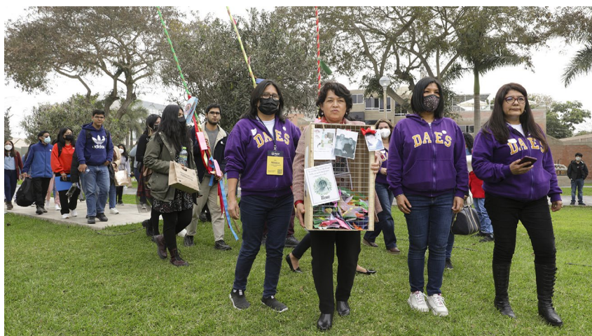
"Urna de la Memoria"

Gracias al apoyo de la DAES se logró generar carteles que señalaron los distintos lugares de la universidad donde había estaciones y urnas de la memoria . El apoyo de la DAES fue también fundamental para contar con las y los psicólogos de contacto de cada unidad como parte de la actividad, los cuales estuvieron alertas a cualquier necesidad que pudiera surgir en alguna estación , ello como parte de los protocolos de contención pensados para la actividad. Del mismo modo, gracias a la participación del proyecto Vivencias del Duelo asociado al Departamento de Psicología se compartió un QR en cada estación con información respecto al autocuidado y procesamiento del duelo.