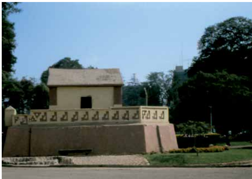
PARQUE DE LA RESERVA 1926-1929. de arriba abajo, de izquierda a derecha: 1) Parque de La Reserva - Paseo principal desde la galería (1994). 2) Parque de La Reserva - Escultura en rotonda principal (1994). 3) Parque de la Reserva - Pabellón Inca.