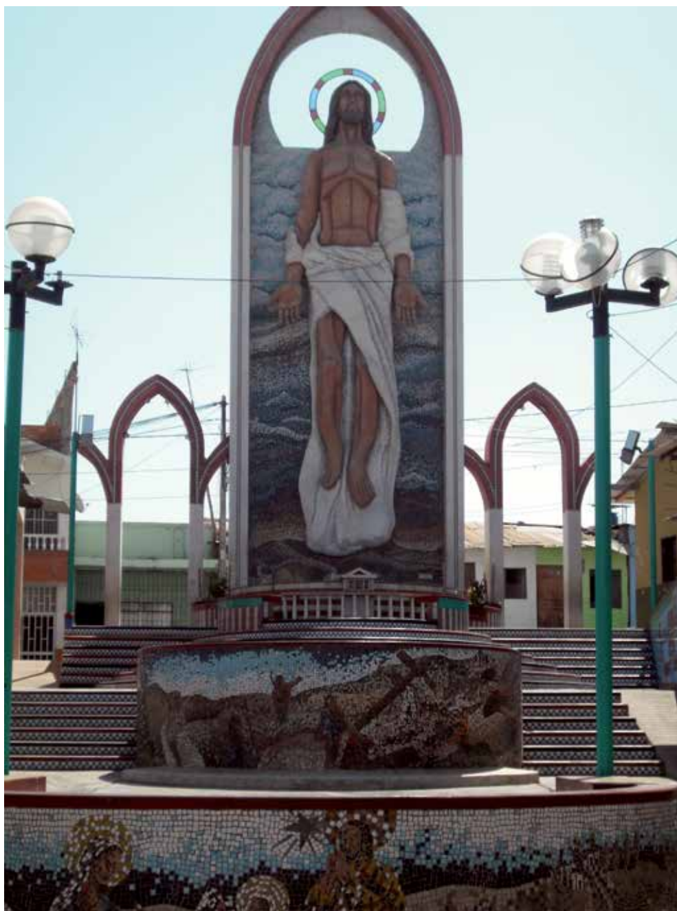
Conjunto dedicado a Cristo Resucitado. Paseo Jerusalén - calle San Martín. Ciudad de Tumbes (2011).