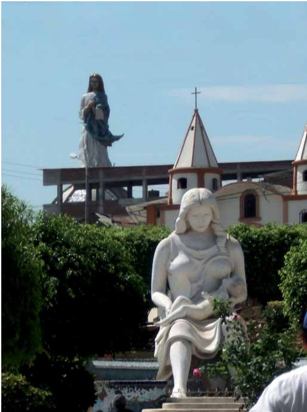
Escultura de La Madre, boulevard de la Madre. Ciudad de Tumbes (2011).