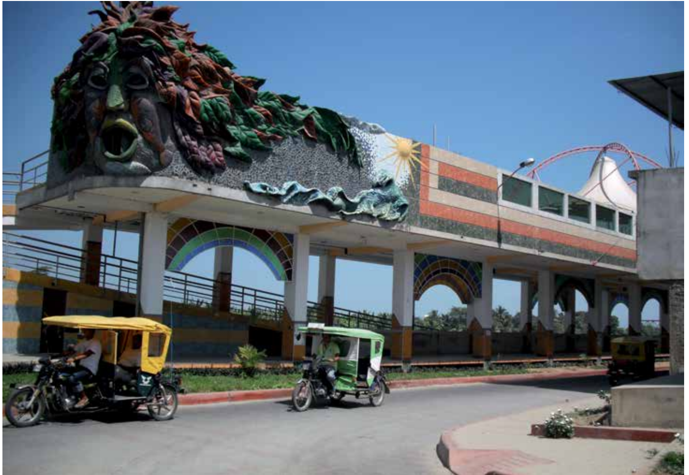
Malecón Benavides, río Tumbes. Ciudad de Tumbes (2011).