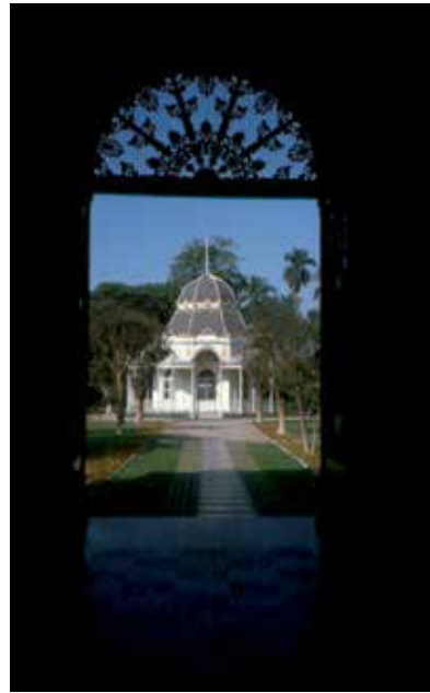
PARQUE DE LA EXPOSICIÓN 1872-1924. de arriba abajo: 1) Parque de La Exposición - Fuente China (2012). 2) Parque de La Exposición - Pabellón Bizantino (1994).