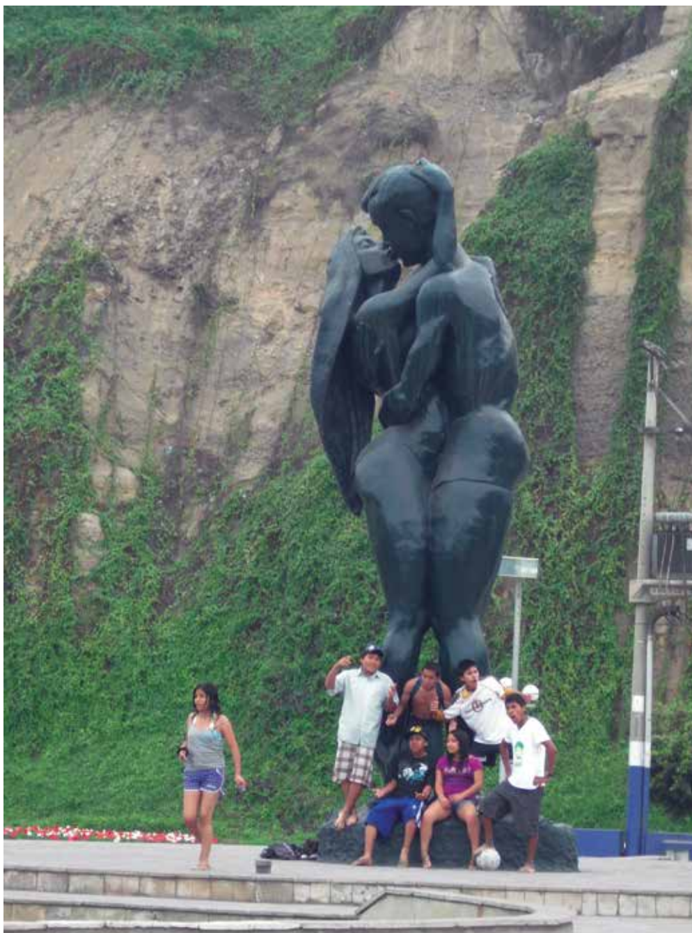
Monumento - Paseo Malecón de Agua Dulce, Chorrillos (2010).