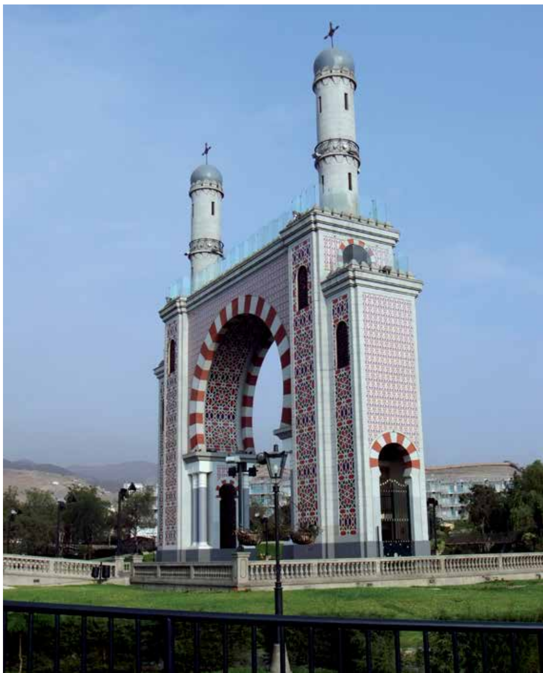
Arco Morisco - Parque de La Amistad, Santiago de Surco (2012).