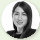
Por: Pamela Morales Nakandakari

Abogada por la Pontificia Universidad Católica del Perú. LLM por la Universidad de Chicago (USA).