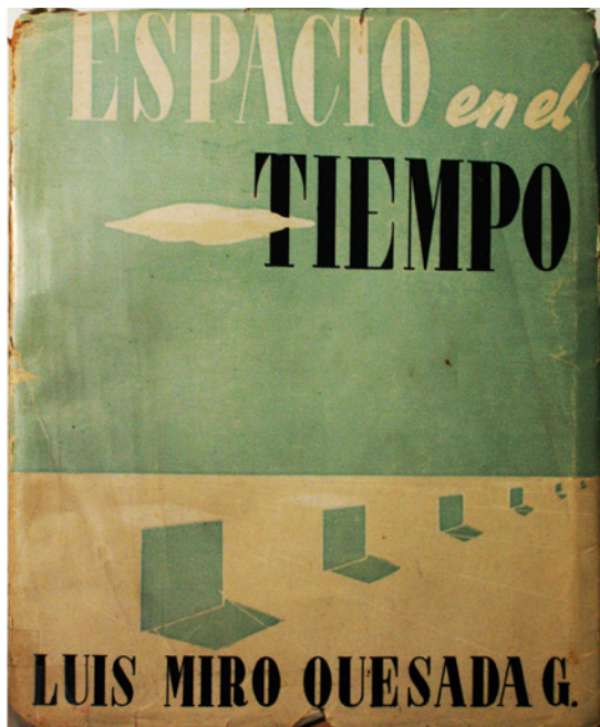
Figura 1. Portada interior del libro de Luis Miró Quesada, Espacio en el tiempo. La arquitectura como fenómeno cultural . Compañía de Impresiones y Publicidad, Lima, 1945.