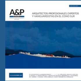
Imagen de tapa :

Federica Visconti (Universidad de Estudios de Nápoles "Federico II". Nápoles, Italia)