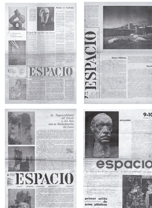
Figura 4. Portadas de las revistas Espacio números 1, 6, 7, 9-10, 1949-51.

rollo del país en todos sus aspectos. Los integrantes de Espacio se fueron sumando progresivamente a la vida pública y cultural del Perú: en lo relativo a sus actividades profesionales, por ejemplo, contribuyeron en las oficinas de vivienda y urbanismo del Estado, que acababan de ser fundadas por el arquitecto Fernando Belaúnde. También aportaron como docentes del Departamento de Arquitectura en la Escuela Nacional de Ingenieros. Así, hacia 1949, la mayoría de los arquitectos de Espacio trabajaban en la Corporación Nacional de Vivienda (CNV) y la Oficina Nacional de Planeamiento y Urbanismo (ONPU), y con ello, tenían no solo la convicción ideológica de cambiar el país, sino las herramientas concretas –los planes de vivienda y los planes reguladores de ciudades– para acelerar y consolidar su proceso de modernización.