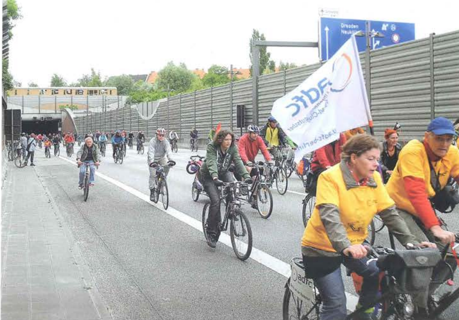
Ciclistas en la autopista en la reunión anual de ADFC (Sternfahrt) en Berlín