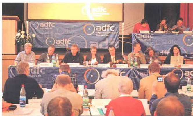
Cada año, se realiza la conferencia de los 16 representantes de las asociaciones estatales CDA.