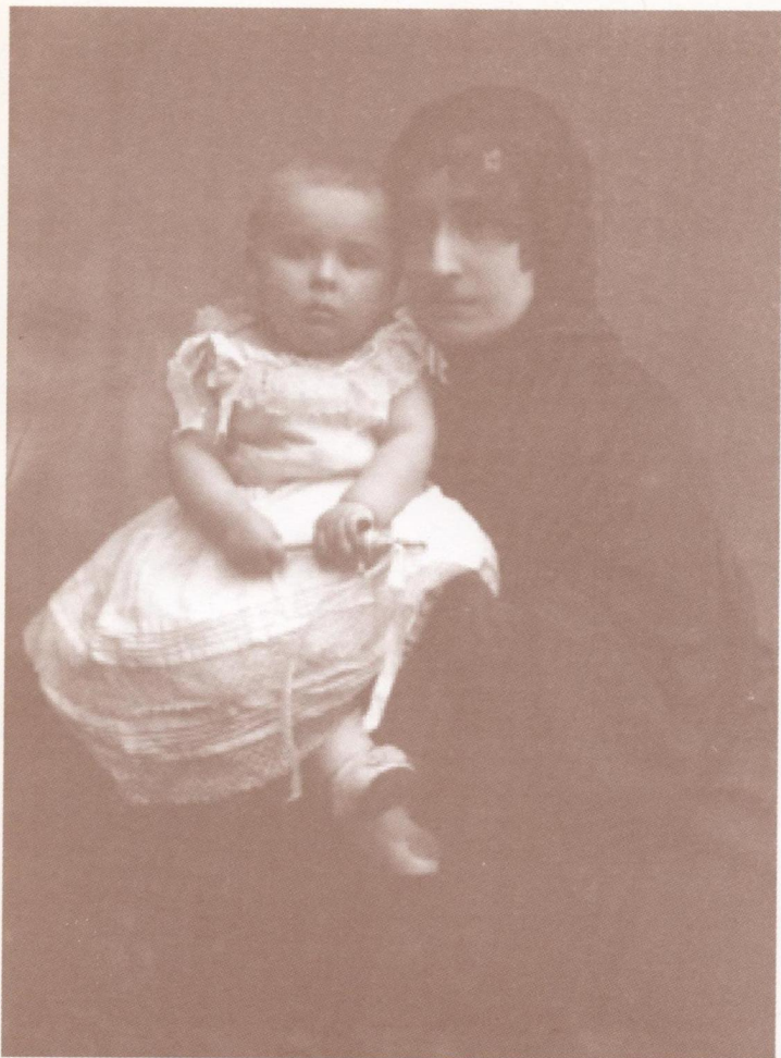
José de la Riva-Agüero y Osma y María de los Dolores Carmen Osma y Sancho Dávila c.1886