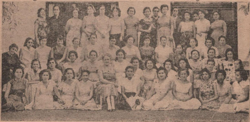
Normalistas de Primera Categoría, en actual servicio, de diferentes lugares del Perú, se concentran en el Instituto de Educación Familiar y Matrimonial para seguir los cursos de Post-Graduadas, en la especialidad de Educación Familiar.

Y esto sucede después de seis años de experimentación de los programas específicos para la Educación Familiar y Matrimonial y cuando el Ministerio de Educación Pública reconoce oficialmente al Instituto. Pocos meses antes de que esto aconteciera la fundadora como Senadora de la República propone en dicha Cámara la ley que crea "La Hora de Educación Familiar" en los colegios. Ley que se promulga bajo el número 12818 extendiéndose así estas enseñanzas a todo el Perú.