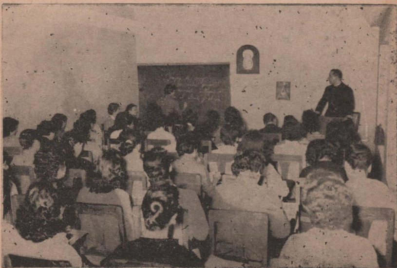
La formación caracterológica, espiritual y moral para el matrimonio constituyen la base de esta Institución.