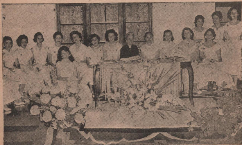
Alumnas que recibieron el diploma, que otorga el Instituto en una de las promociones.