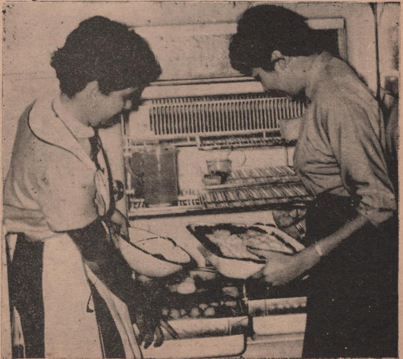
Aprendiendo a hornear en las clases de Cocina Repostería.