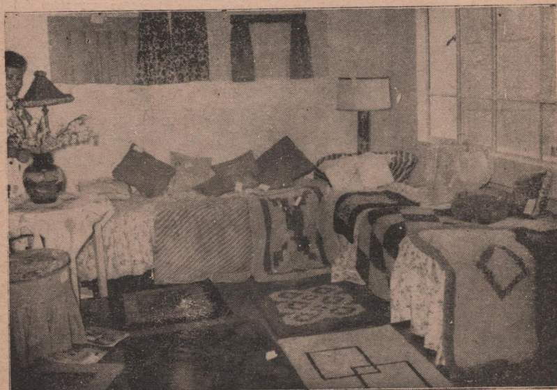
Complementos de Decoración Interior confeccionados por las alumnas de este curso.