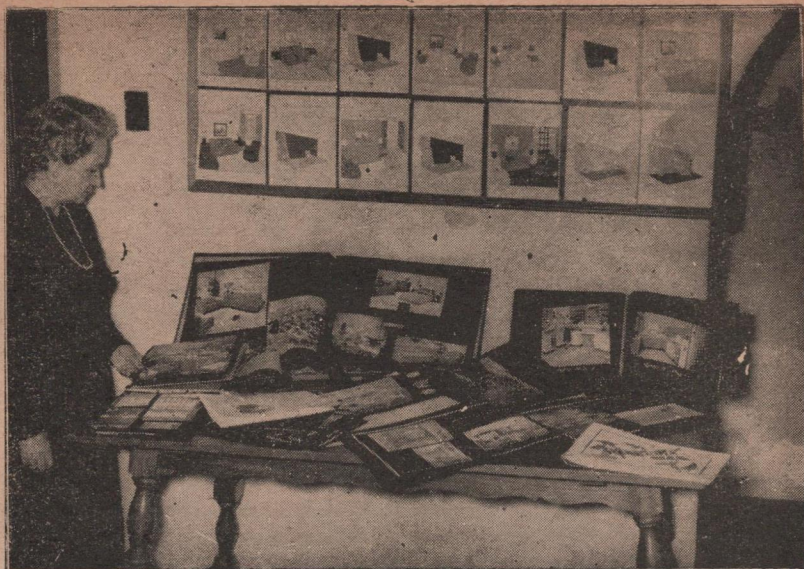
Parte de la exhibición de proyectos de Decoración Interior presentados por las alumnas.