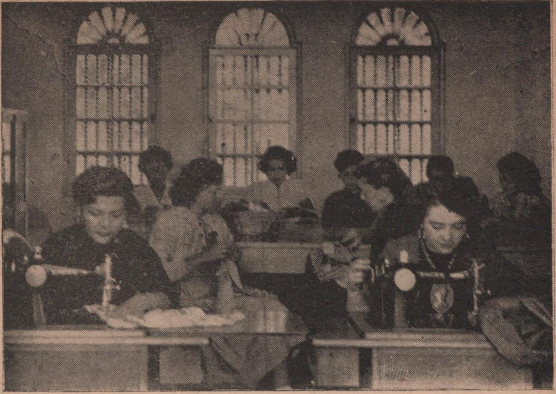
Las alumnas cosiendo la ropa de la familia.