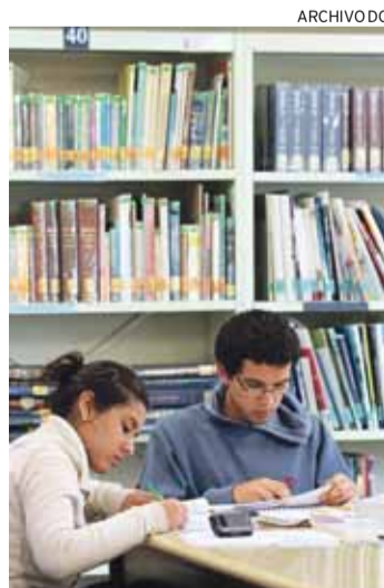
AYUDAS ECONÓMICAS. Pueden postular hasta el 12 de abril.

La convocatoria del Fondo Marco Polo 2013-1 está abierta hasta el 12 de abril. Para ac-