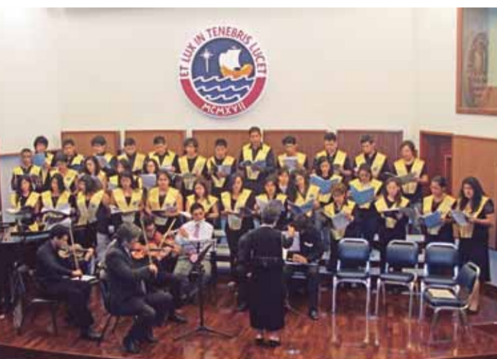
Concierto de lujo. El Coro y Conjunto de Cámara PUCP organizó su propia bienvenida al cachimbo y deleitó a toda la comunidad universitaria con un repertorio de Tchaikovsky , Mozart y Haydn .