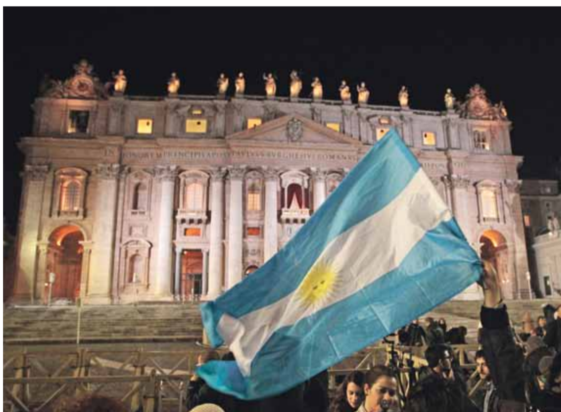
EN ROMA. Los argentinos fueron quienes más celebraron, en la Plaza de San Pedro, la elección del papa Francisco.

“El Papa es una persona hecha para trabajar el evangelio ahí donde hay que trabajarlo: en la calle, los templos y las universidades”.