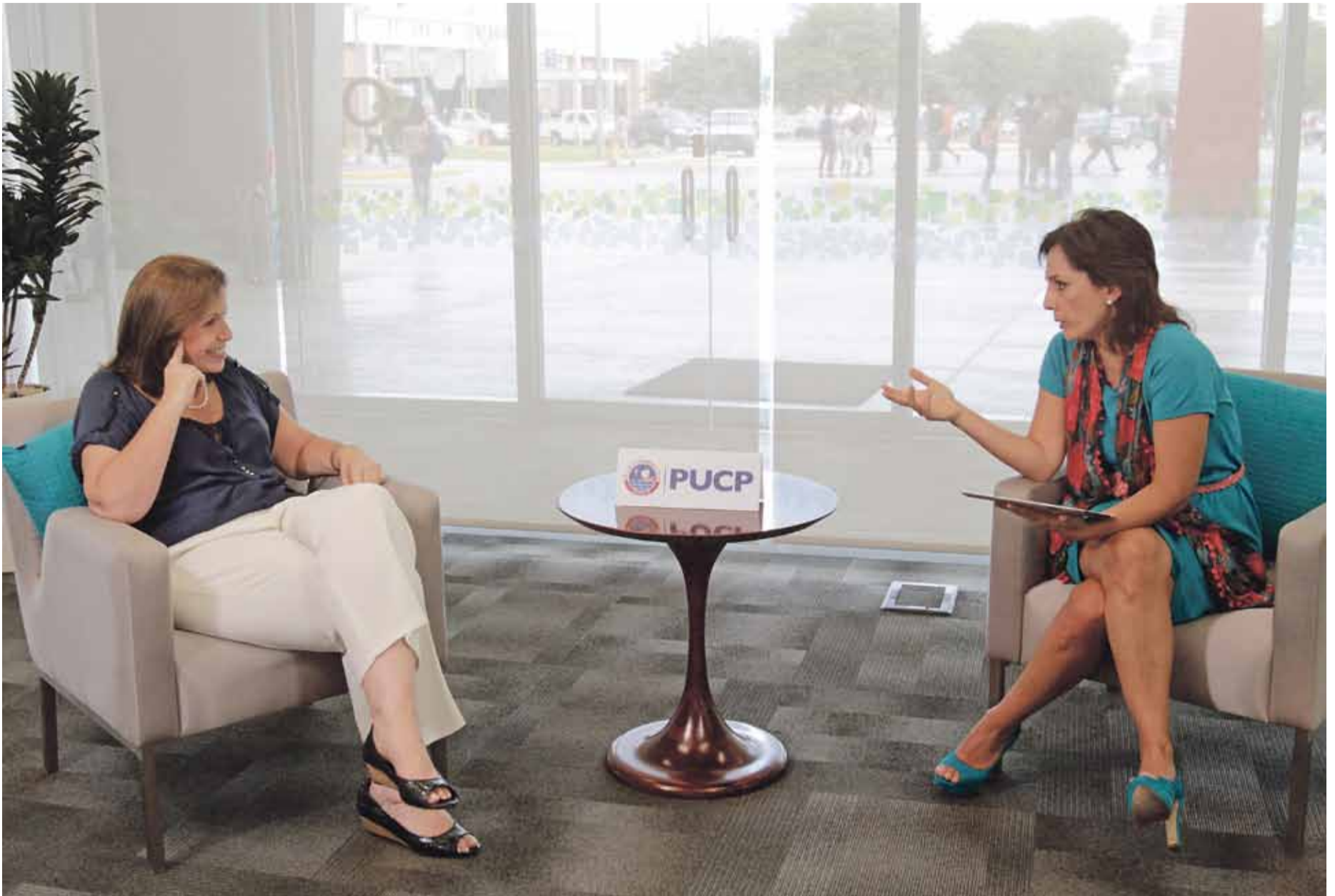
EN DEMOCRACIA. Lourdes: "El juego democrático consiste en que si alguien recibe el favor del pueblo, hay que respetar esa voluntad". Mira la entrevista completa en www.youtube.com/pucp

Por PATRICIA DEL RÍO Periodista y egresada de la PUCP