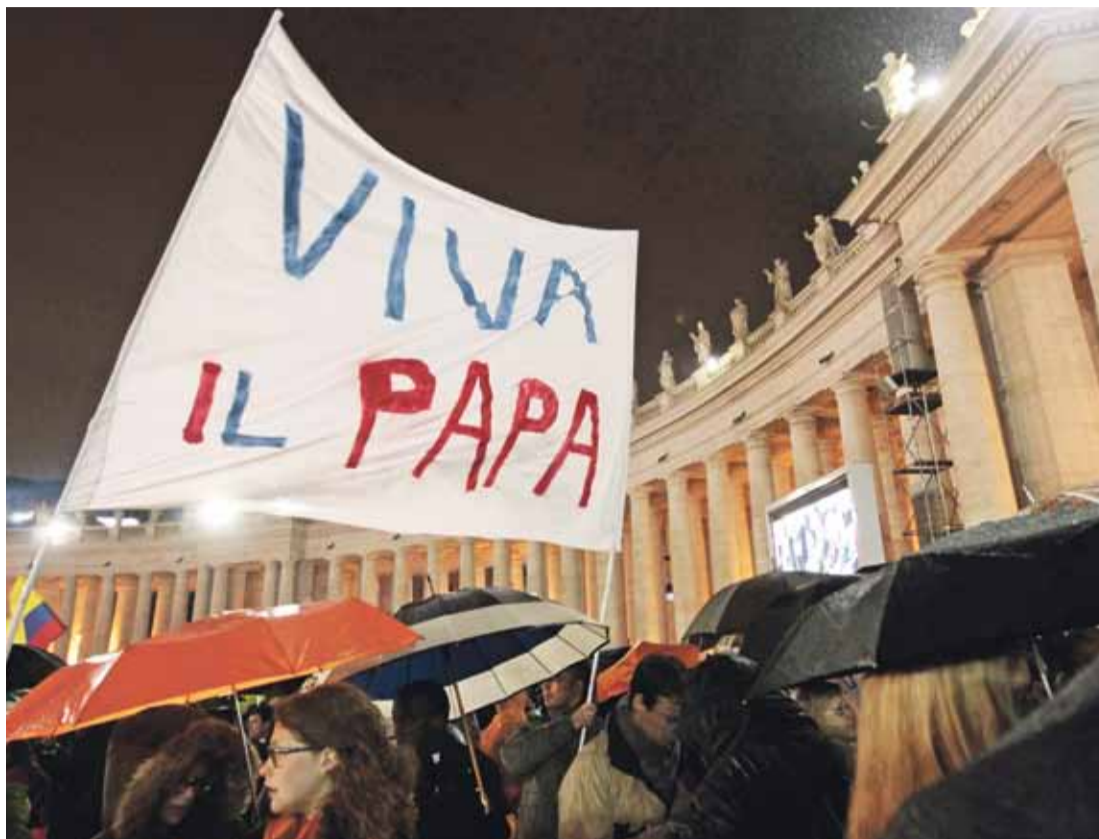
HUMO BLANCO. Los visitantes esperaron bajo la lluvia la elección del nuevo Papa a las afueras de la Capilla Sixtina.