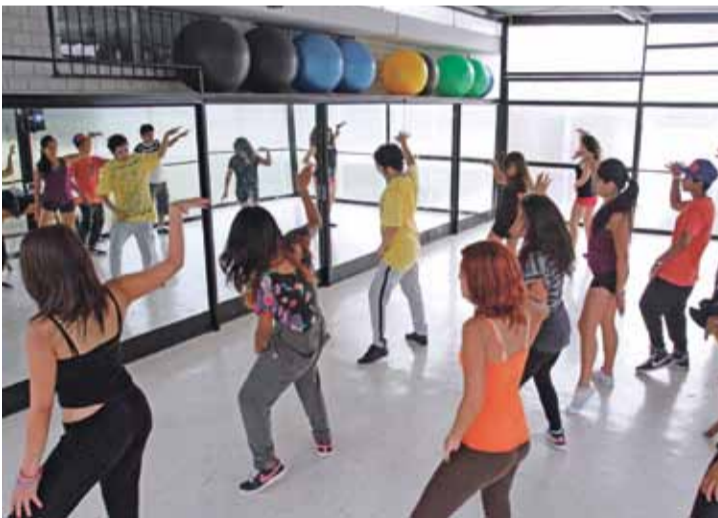
Danza urbana. Grupos de alumnos de EEGG Ciencias y otras especialidades participan de este taller con lo mejor del street jazz , salsa y hip hop .