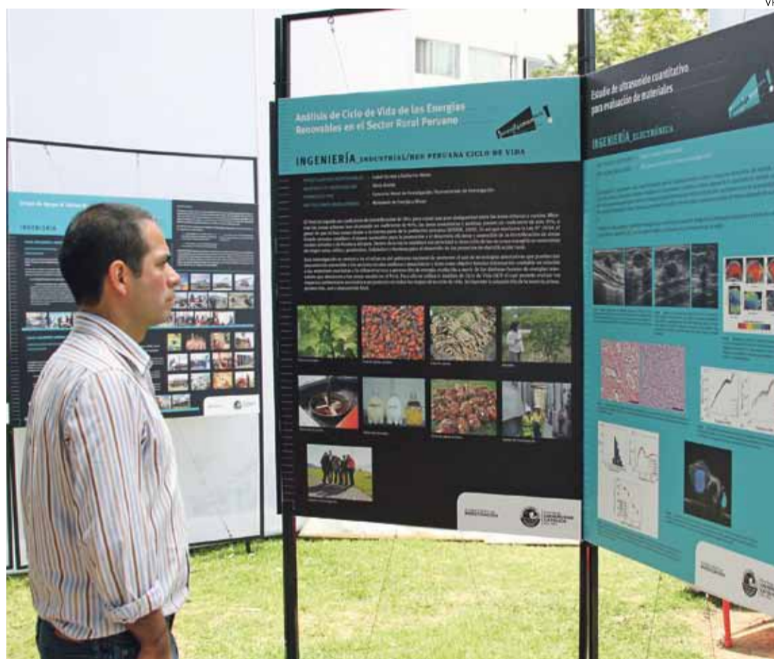
MULTIDISCIPLINARIO. Este año, Investiga PUCP 2013 se realizará del 10 al 19 de septiembre, en el Jardín de Artes.

Como en ediciones anteriores, se quiere que los trabajos a exponer en Investiga PUCP pertenezcan a todas las especialidades y campos de estudio, y constituyan una muestra de la pluralidad de intereses de la Universidad. Pueden postular todos los docentes, ya sean ordinarios o contratados, que hayan realizado una investigación en los dos últimos años o que se encuentre en curso. Los