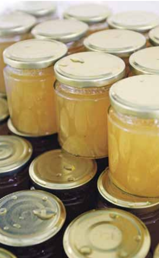
PRODUCTO. Mermelada de piña lista para el consumo.