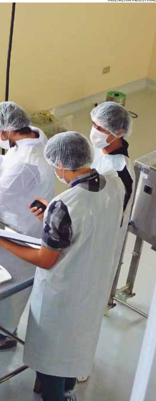
Procesos Industriales, que se inaugurará este jueves.