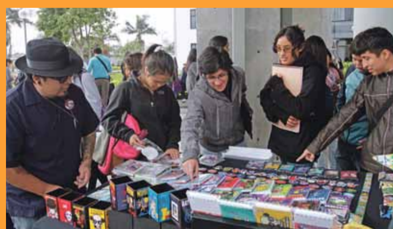
El 4 y 5 de octubre se realizó, en el Auditorio de Derecho, el 7mo. Coloquio de Estudiantes de Diseño Gráfico "Yo soy diseñador", que incluyó talleres de ilustración y serigrafía, expoventa y presentaciones artísticas.