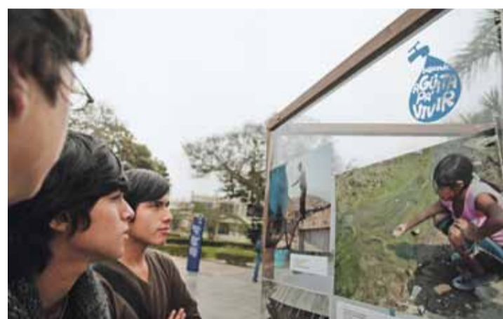
La exposición del concurso fotográfico "Buscando... agüita pa' vivir" fue resultado del taller dictado en colegios de las Lomas de Carabayllo por comunicadores egresados de la PUCP.