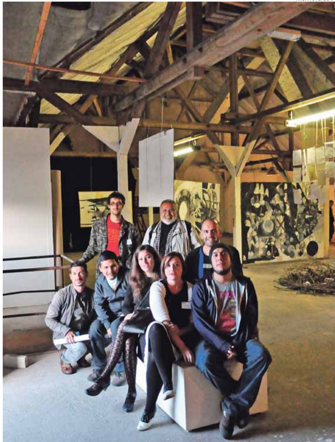
REPRESENTANTES. Cuatro alumnos, cinco egresados y dos profesores de la Facultad de Arte viajaron a Alemania.

El establecimiento elegido para realizar este festival fue un complejo de edificios históricos que conformaban un antiguo matadero, en la zona conocida como Messering 8. Los organizadores adaptaron el lugar y lo convirtieron en un espacio propicio para el montaje de obras, exposiciones, construcciones de diversa índole y talleres impulsados por artistas de Europa y del resto del mundo. “En un principio no tenía idea de dónde iba a ser. Me decían ‘ba-