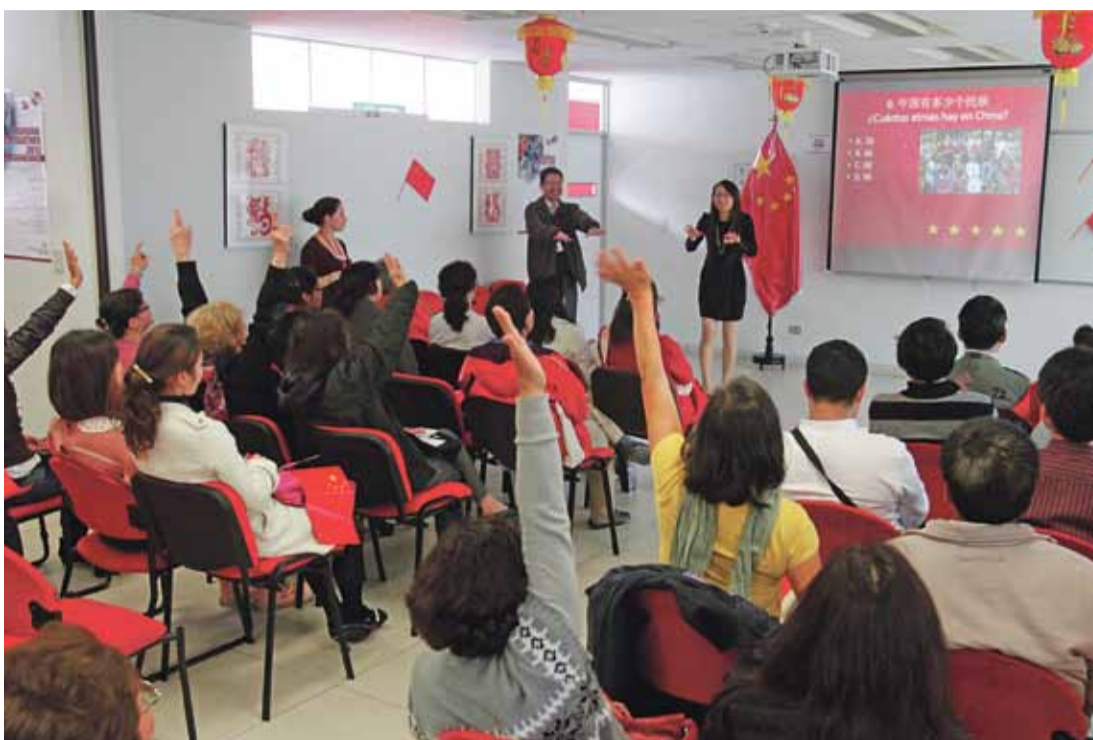
Con diversas actividades culturales y recreativas se celebró, la semana pasada, el 63 aniversario de la fundación de la República Popular China. La sede del Instituto Confucio de la PUCP fue el lugar escogido para esta fecha especial.