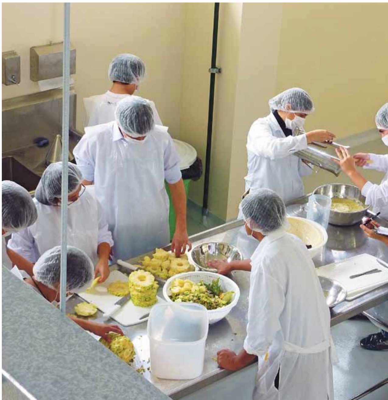
SACÁNDOLE EL JUGO. Alumnos de Ingeniería Industrial trozan la fruta para elaborar jugos y néctares en el nuevo Laboratorio de Pro

BIEN EQUIPADOS. Uno de los principales objetivos de este nuevo espacio es fortalecer la actividad académica de los futuros ingenieros industriales. Para eso, la Universidad ha adquirido ocho equipos que facilitarán las tareas de producción alimentaria. Así, en su sección de operaciones unitarias, cuenta con equipos de cocción (o marmita), evaporación, secado