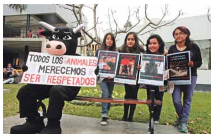
Miembros de la Agrupación para la Defensa Ética de los Animales (ADEA) recolectaron firmas en el tontódromo en contra de las corridas de toros como parte de su campaña "Cultura sin violencia".