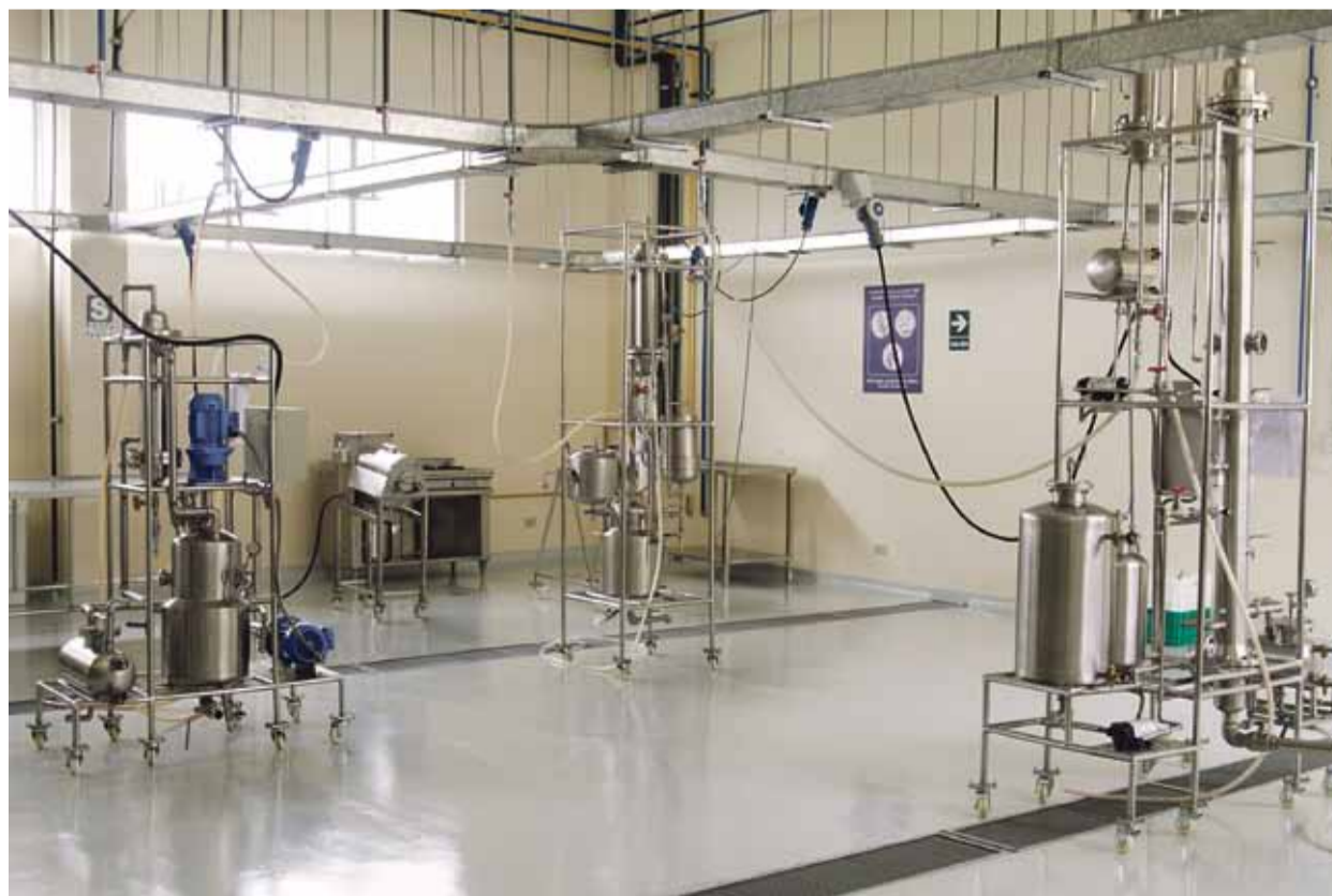
MAQUINARIA. El laboratorio cuenta con equipos de cocción, evaporación, pulverización, extracción sólido-líquido y destilación.