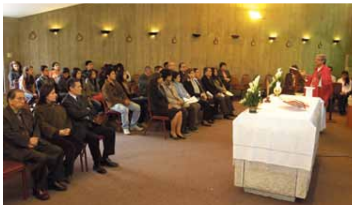
La Facultad de Administración y Contabilidad celebró sus 80 años con diversas actividades de confraternidad, así como con una misa de acción de gracias que se llevó a cabo en el CAPU.