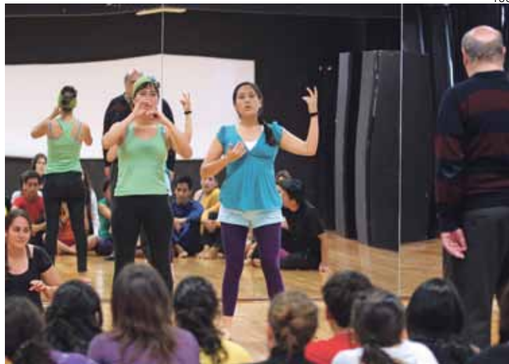
EN ESCENA. Más información en www.escola.pucp.edu.pe/teatro

ENTRENAMIENTO INTEGRAL Y MONÓLOGOS. Dirigido a personas que han llevado talleres de formación actoral o que han finalizado el taller Nociones de Actuación en Escena del TUC. La práctica incluye el manejo de las herramientas naturales (cuerpo, voz, espacio), facultades potenciales (concentración,