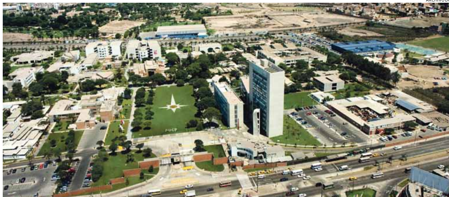
NOS DA LA RAZÓN. Este fallo señala que el juicio sobre la interpretación de los testamentos seguirá su curso.

SE RECHAZA PEDIDO DE LA DEFENSA DEL ARZOBISPADO DE CORTAR JUICIOS SOBRE EL TESTAMENTO DE RIVA-AGÜERO, AMPARÁNDOSE EN LA SENTENCIA DEL 2010 DEL TRIBUNAL CONSTITUCIONAL.