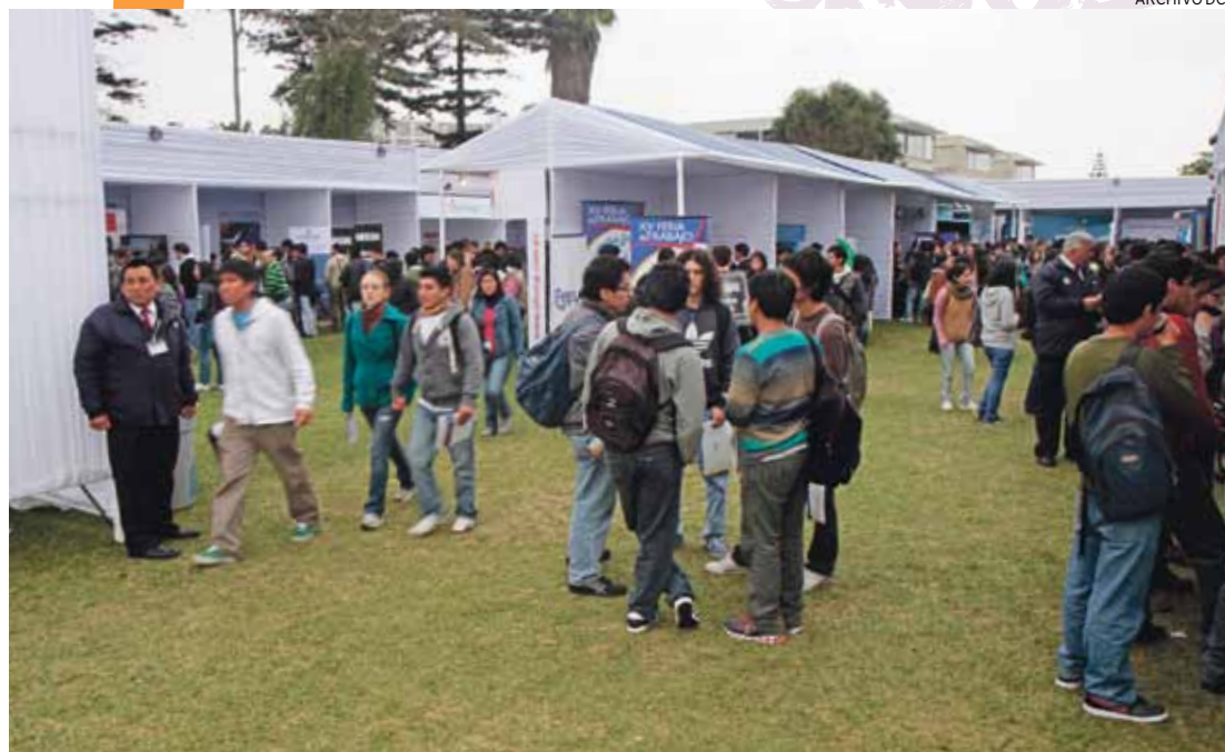
PARA TODOS LOS GUSTOS. 39 organizaciones participarán en esta nueva edición de la Feria de Trabajo.

RIGUROSA SELECCIÓN. “La mayor parte de los alumnos que estudian acá lo hacen