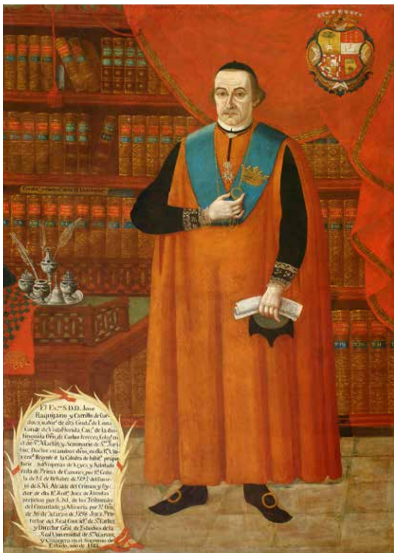
Lector de libros prohibidos, Baquijano y Carrillo aparece representado con sus libros, entre ellos la Encyclopédie ou Dictionnaire raisonné des sciences, des arts et des métiers (Museo de Arte. Universidad Nacional Mayor de San Marcos).