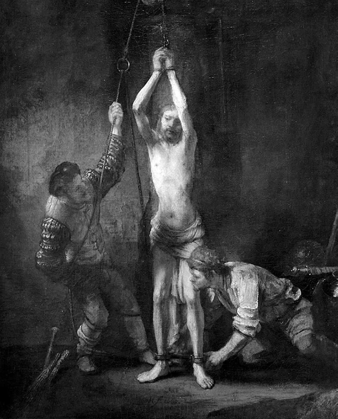
Flagelación de Jesús , cuadro de Rembrandt conservado en el Hessisches Landesmuseum (Darmstadt, Alemania).