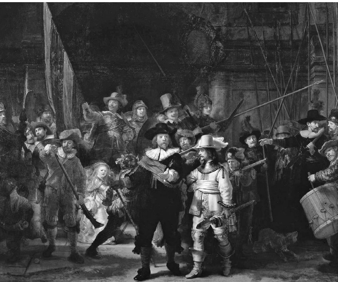
La ronda de noche , cuadro del pintor y grabador holandés Rembrandt Harmenszoon van Rijn, parte de la colección del Rijksmuseum de Ámsterdam.