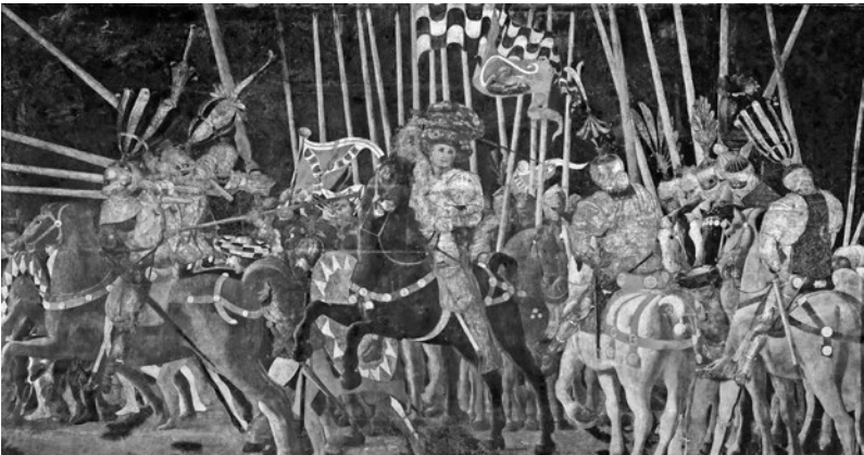
La batalla de San Romano , tríptico del pintor italiano Paolo Uccello. Actualmente se encuentra repartido en tres museos: el Louvre de París, la National Gallery de Londres y la Galería de los Uffizi en Florencia.