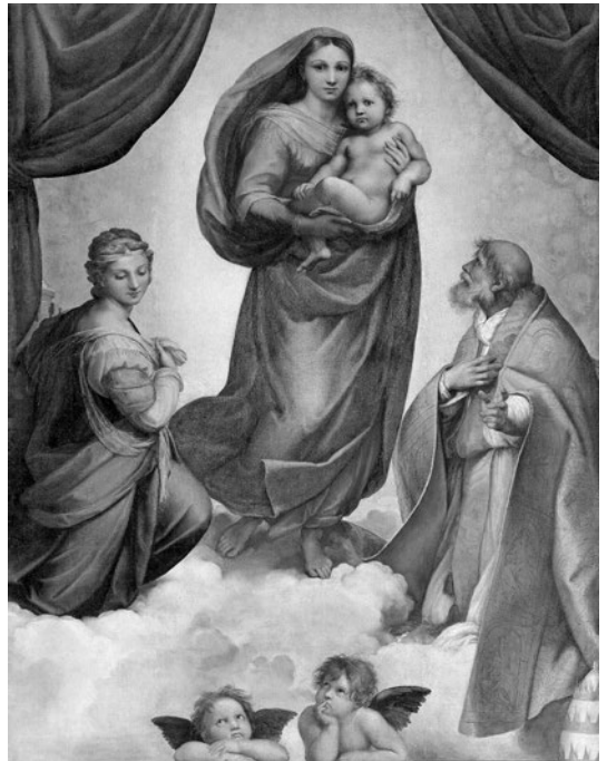
Imagen invertida : una simple inversión, a manera de espejo, de la Madonna Sixtina deja en evidencia el desequilibrio que se produce en la composición del cuadro.