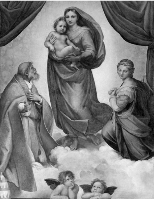
Madonna Sixtina , del pintor italiano Rafael Sanzio. Actualmente se encuentra en la Gemäldegalerie alter Meister de Dresde, Alemania.