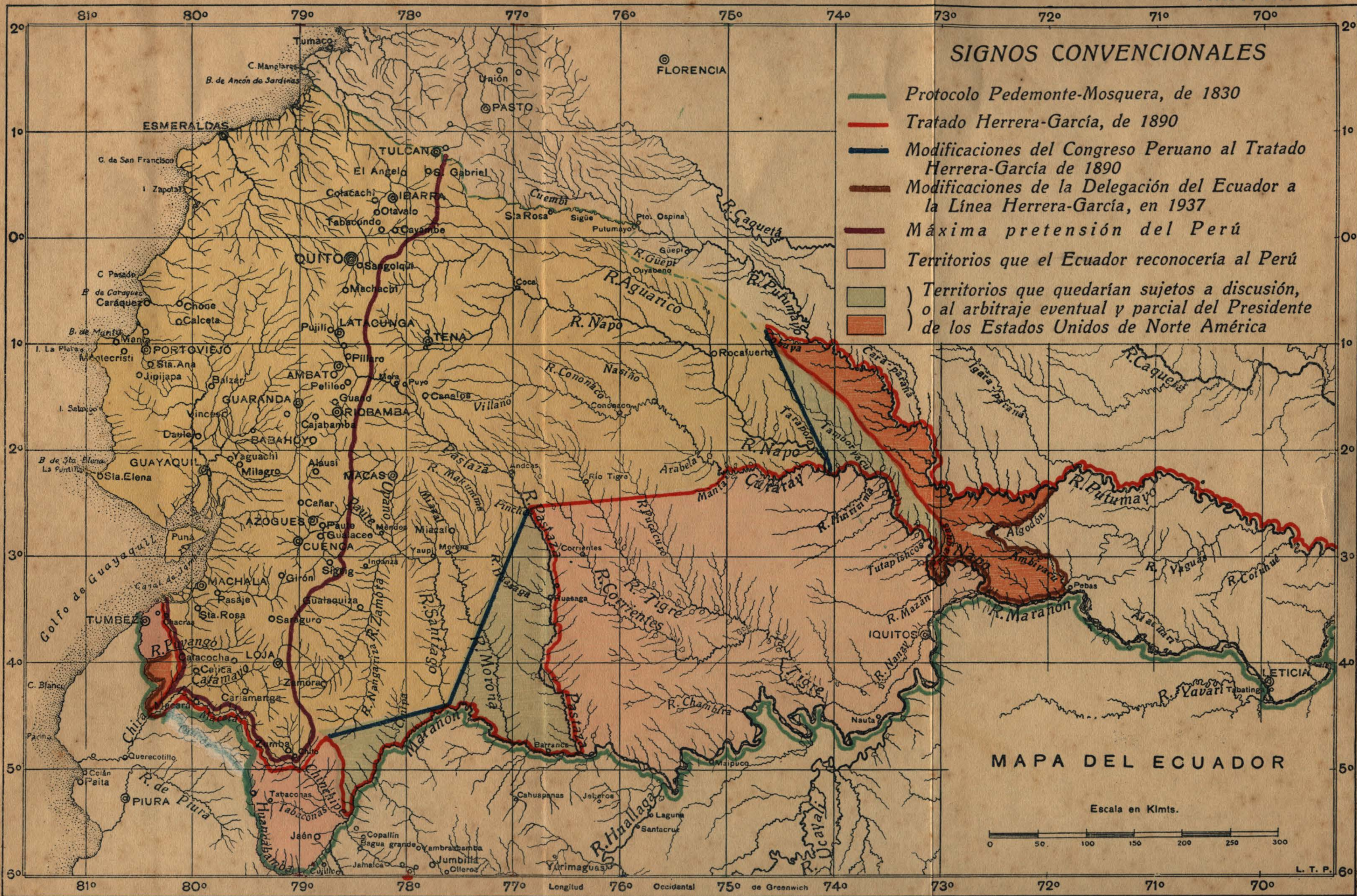
MAPA DEL ECUADOR