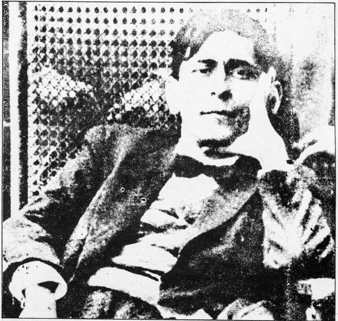
Hay una polémica de tres décadas. ¿Cuál fue la posición de Mariátegui frente al PC?