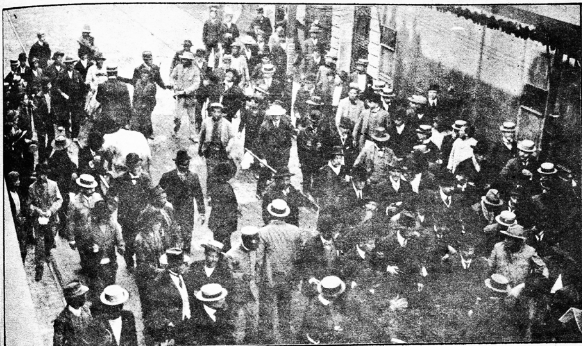
Las manifestaciones de 1930 marcaron los primeros hitos de las reivindicaciones sociales aún en germen.