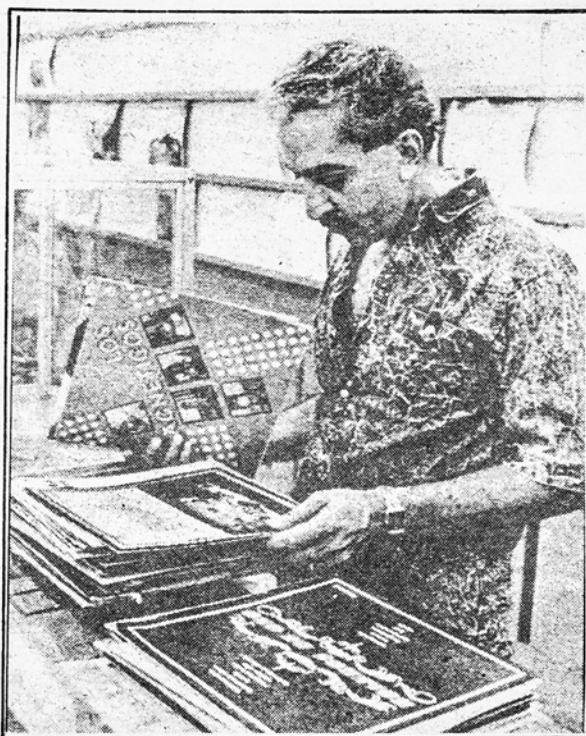
Juan Formell, director y creador de VAN-VAN.

“El escritor tiene tiempo para analizar el fenómeno, al igual que el dramaturgo. Y la novela tiene tantas páginas y la obra de teatro, hora y media. Yo con tres minutos y una