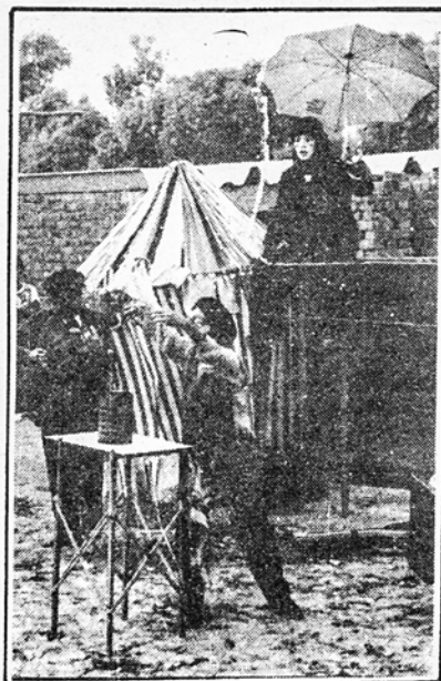
MOTIN invadió Independencia.

Dio lectura al manifiesto de MOTIN al pueblo peruano y finalmente recordó que en otros lugares del mundo se estaban desarrollando iguales eventos. Un representante de la municipalidad de Independencia ofreció una recepción. Finalmente los asistentes se sirvieron un almuerzo en medio de la algarabía general.