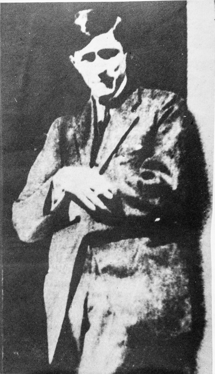
Dos polémicas definen a Mariátegui. Con la III Internacional discrepó pero no rompió. Con Haya y el aprismo discrepó y rompió.

ENTRE el 14 y el 18 de abril la Universidad de Sinaloa (México) organizó un coloquio internacional sobre el pensamiento de José Carlos Mariátegui. En una apretada síntesis sobre la reunión podríamos decir que desde el inicio los concurrentes se escindieron entre quienes fueron exclusivamente a "celebrar" a Mariátegui (los cincuenta años de su muerte), realizando todas las concesiones posibles al retoricismo y el mal gusto, y quienes por el contrario estaban más interesados en "discutir" sus planteamientos, ubicándolos al interior de la conflictiva historia del socialismo y del movimiento comunista.