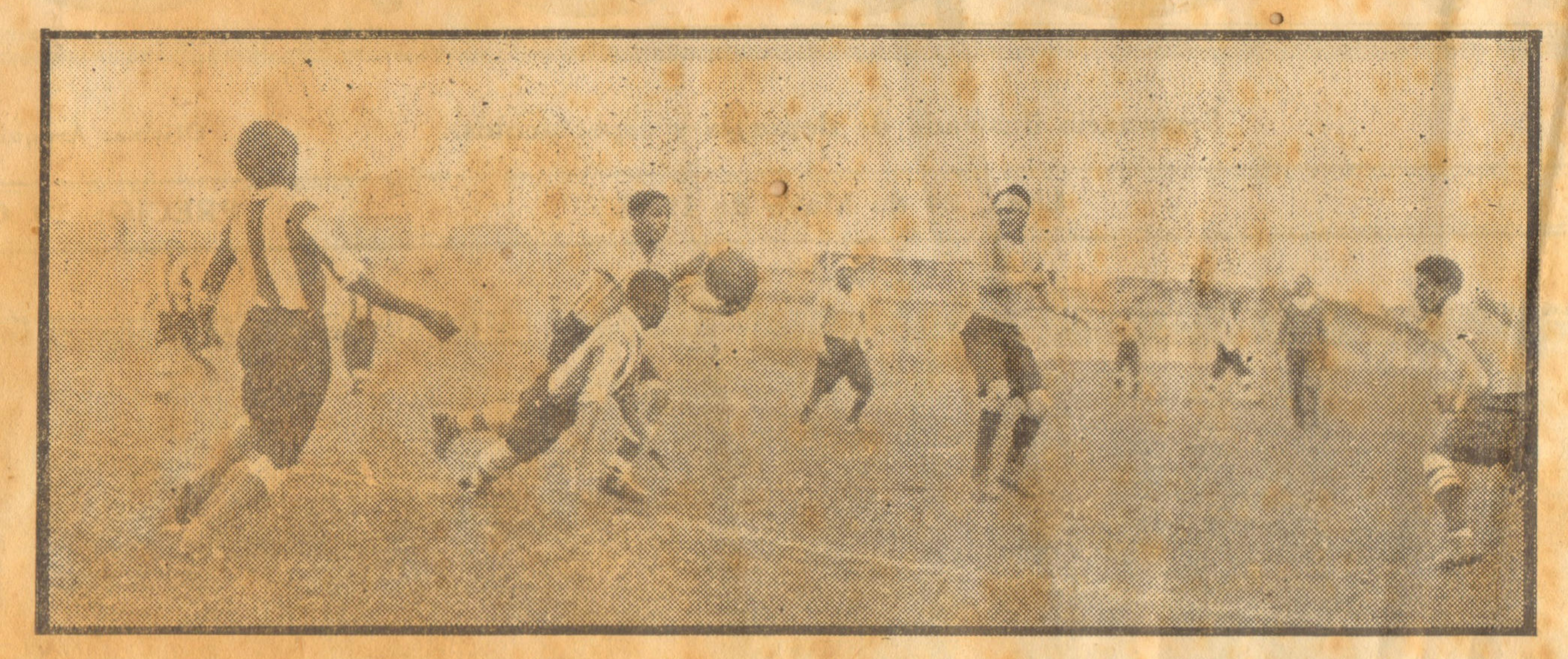
Escena del mtch que jugaron el domingo los equipos del Alianza Lima (Reserva) y el Alianza Condor.

LA COMPLEJIDAD QUE SE ATRIBUYE A LA SELECCION DE NUESTRO EQUIPO REPRESENTATIVO ES MAS APARENTE QUE REAL