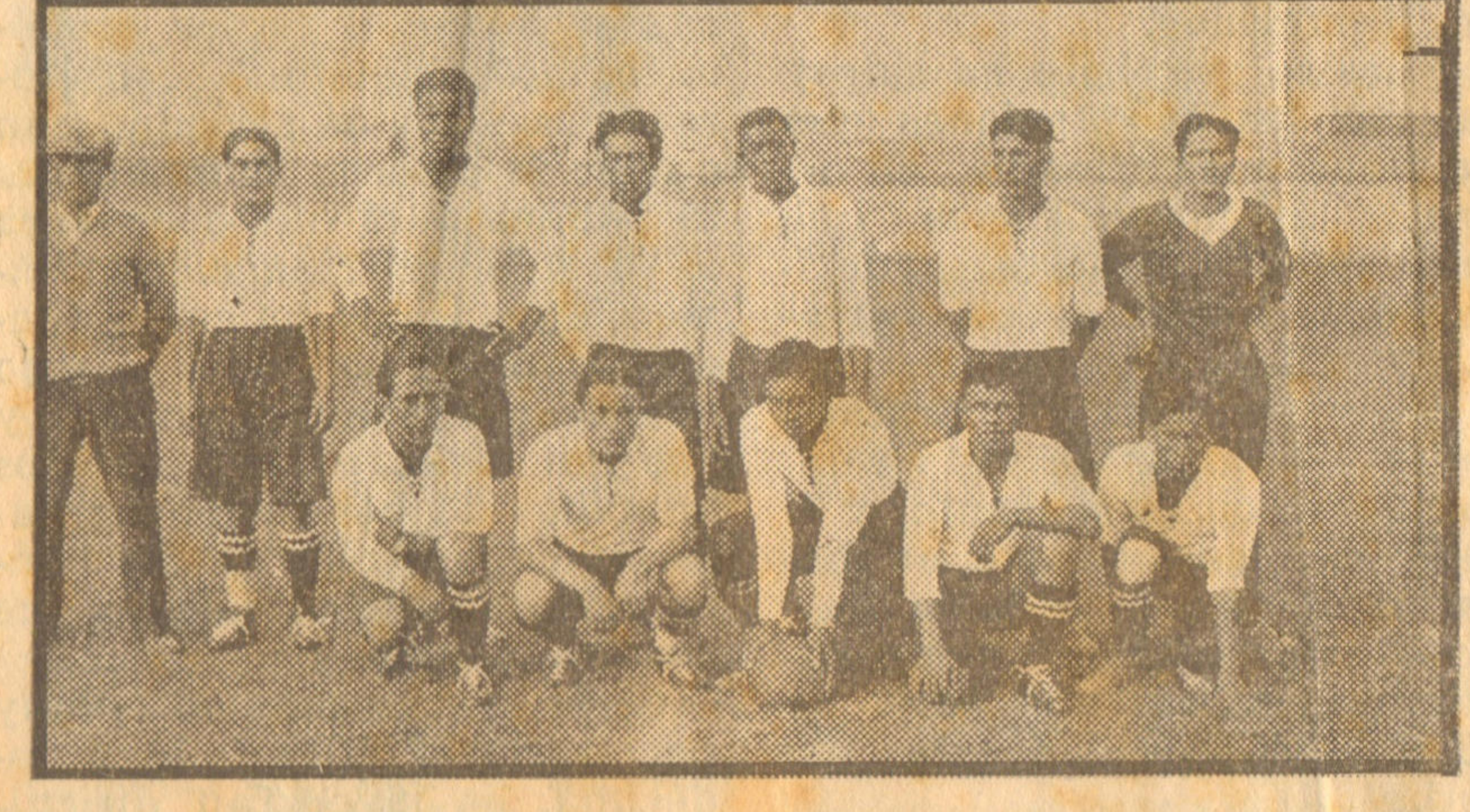
Jugadores que integraron el cuadro del "Fernandini" que jugó el domingo con el de intermedia del "Cóndor".

Es indudable que la ausencia de dos jugadores del cuadro titular del Alianza Lima, tiene que fomentar comentarios y con el fin de evitar que se tuerzan de la realidad, convendría que la Federación expresara