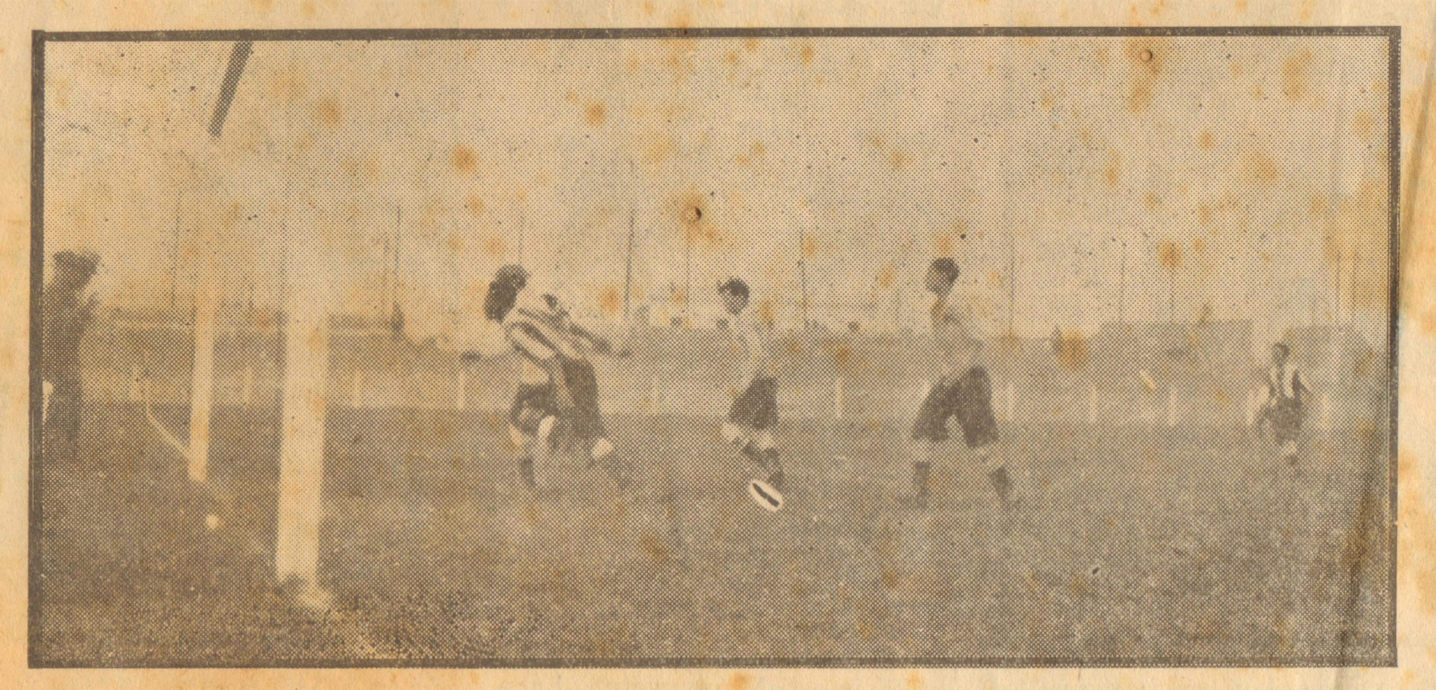
Escena del match del equipo de rserva del Alianza Lima con el Sport Uruguay.

EL ALIANZA LIMA SE ENFRENTARA AL SELECCIONADO QUE NOS REPRESENTO EL ULTIMO CAMPEONATO SURAMERICANO