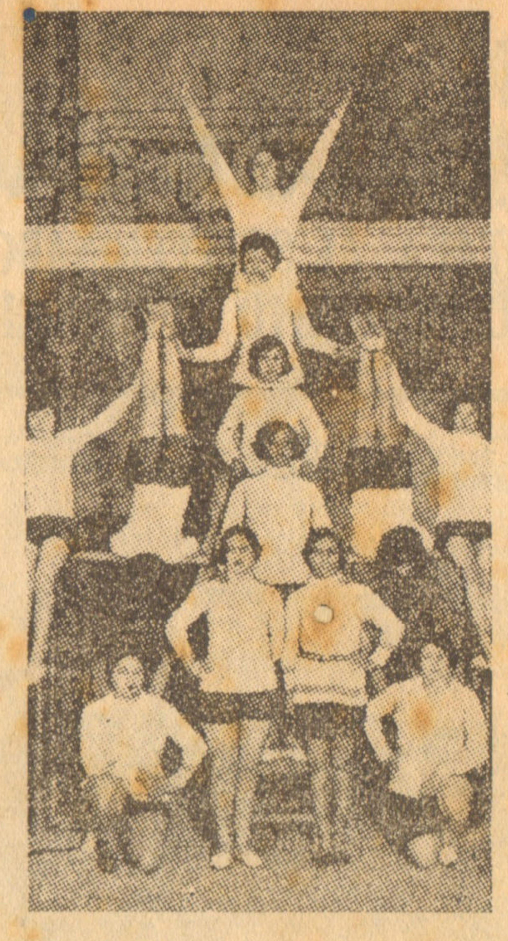
Gimnasia armónica, en la Real Sociedad Gimnástica Española, de Madrid.

Otra hipótesis a que también hemos aludido es al posible temor que puedan abrigar nuestros dirigentes de que al no regresar vencedor el equipo peruano, o ante la noticia de alguna derrota, puedan soliviantarse los ánimos y reproducircho en los paises que ofrecie- se las manifestaciones de proron, igual que nosotros, parti- testa que se realizaron a raiz de la derrota que infringió el cudir en ayuda del deporte equipo paraguayo al nuestro, ecuatoriano.