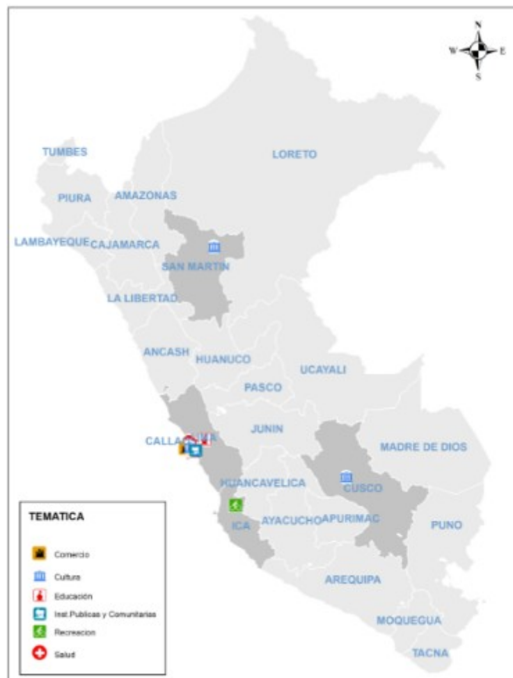
Figura 1. Distribución geográfica a nivel regiones del Perú de las tesis de Arquitectura - UPC

Igualmente se observa de la muestra que la mayoría de tesis se han desarrollado en la temática de Cultura con 08 tesis, 06 que corresponde a Educación y 02 en Salud. Para Recreación, Instituciones Públicas y Comercio con 01 tesis.