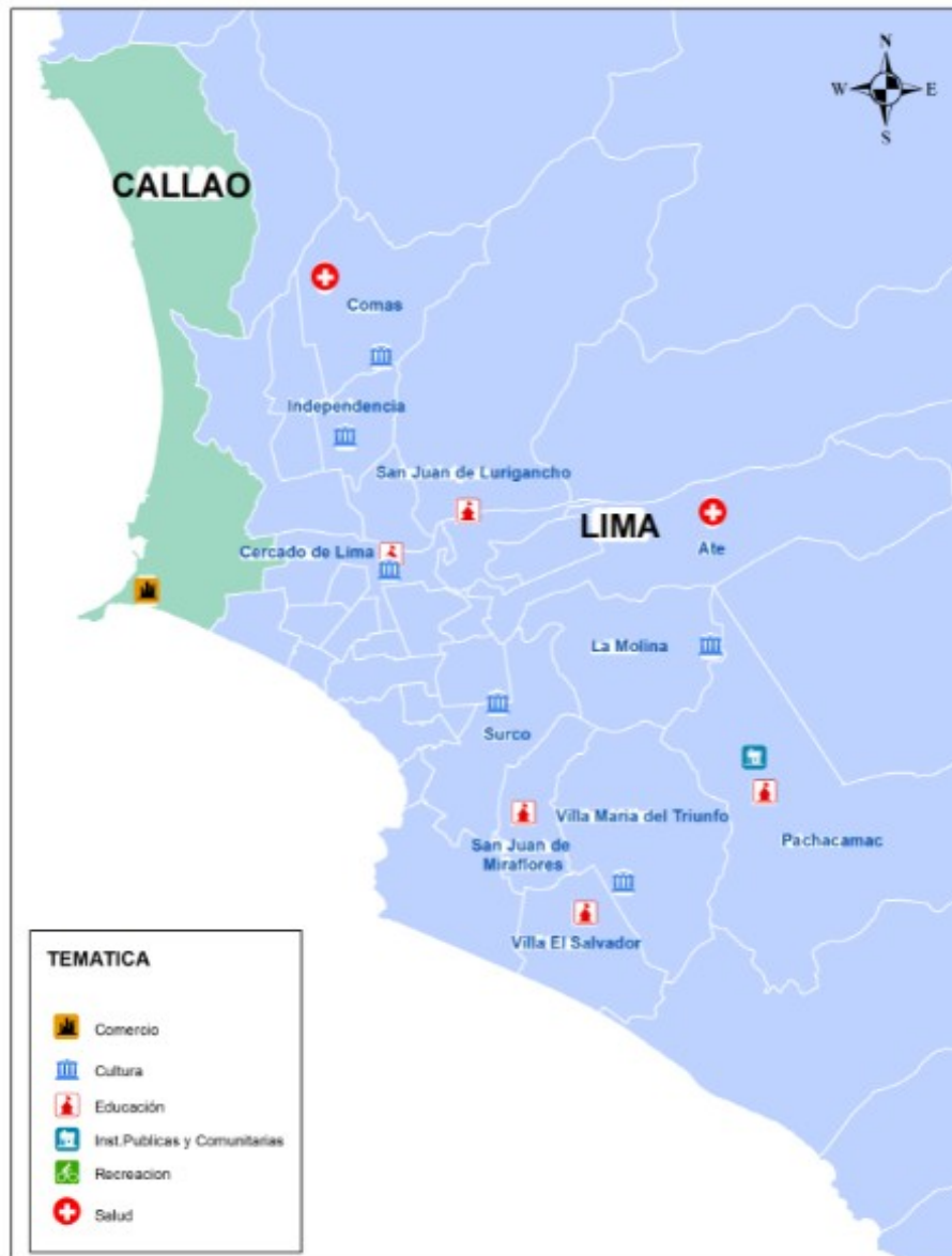
Figura 2. Distribución geográfica a nivel regiones del Perú de las tesis de Arquitectura - UPC

La figura 3 presenta la representación geoespacial de las tesis a través de la versión Web del ArcGIS. Desde aquí los usuarios podrán acceder a los contenidos de las tesis.