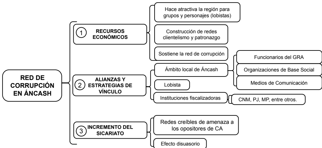
Figura 3. Variables explicativas del cómo es que surge una red organizada de corrupción en la región Áncash

Después de conocer los hechos suscitados en el caso de investigación se pasará a explicar las variables explicativas. Para diversos entrevistados, César Álvarez era un tipo sin instrucción, agresivo y con poca estrategia para poder desarrollar una red de corrupción 16 . Se debe tener claro que, al postular a la primera presidencia regional, Álvarez no tenía una idea preconcebida de construir una red de corrupción, solo que, como señalan los entrevistados, se le presentaron las oportunidades y las aprovechó. Se sostiene que tres son las variables que responden a la pregunta de investigación; a continuación, se presenta la figura 3, donde se presentan dichas variables.