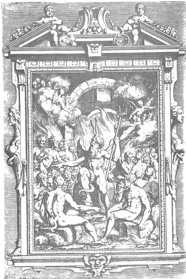
Nº Cat. 23

7 t. T. I: 30.2 x 22.5 cm. [1 h.] + XXVIII p. + 432 p.