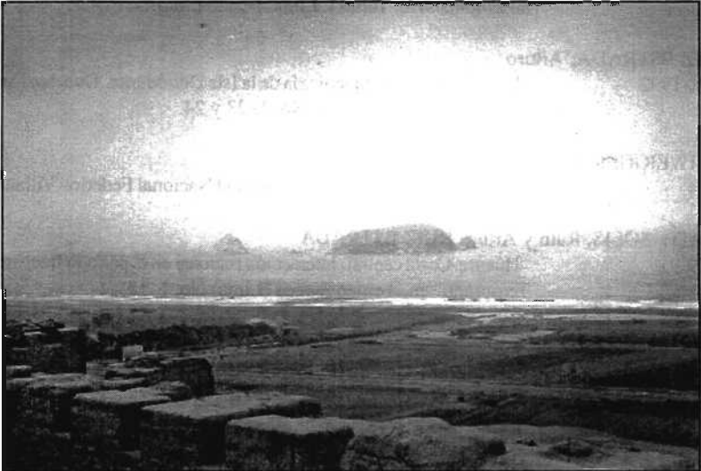
Islas de Pachacamac