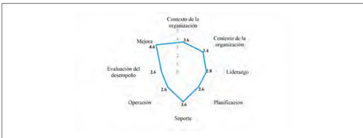
FIGURA3. Resultados de las actividades de gestión de la información

El Instituto Público de Investigación, presenta un sistema de gestión del conocimiento de nivel medio (en promedio 3.22), lo que indica que la entidad no tiene del todo claro los objetivos de la gestión del conocimiento, cuenta con ciertas herramientas de colaboración para permitir conectar a su propio personal, creando redes de conocimiento, y así lograr que sus colaboradores compartan buenas prácticas. A pesar, que el pilar con puntuación más alta sea el contexto organizacional (3.6), dentro de dicho pilar se evaluó cinco puntos que son: organización y su contexto, necesidades y expectativas de las partes interesadas, alcance del sistema de gestión del conocimiento, sistema de gestión del conocimiento, y cultura de gestión del conocimiento; de los cuales los tres últimos puntos, son los más críticos de la entidad.