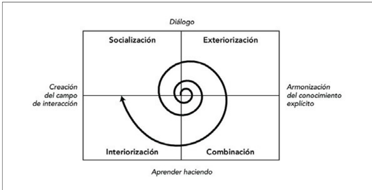
FIGURA1. Espiral del conocimiento