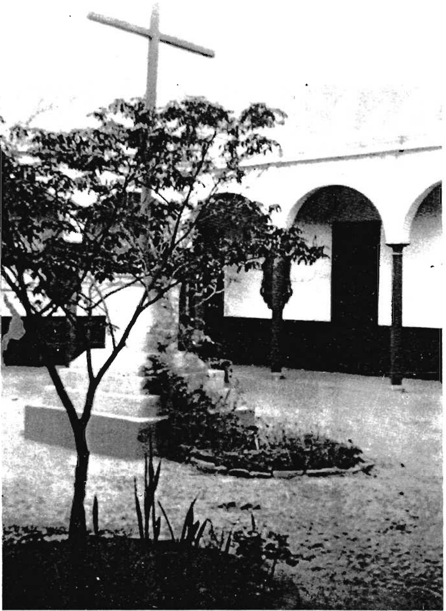
Vista de uno de los claustros del convento de los Descalzos de Lima.