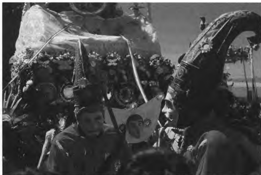
Guerreros Otomanos de la danza del Turco. Fiesta de la Virgen de la Asunción en Chivay.