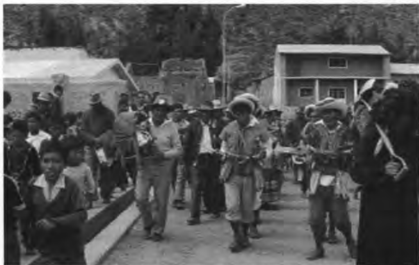
Danzantes de Khamile junto al mayordomo que lleva el Niño San Hilarión.

Entre el personal de servicio que apoya al mayordomo tenemos a la despensera , que custodia los alimentos y supervisa que no se desperdicien; la cocinera , encargada de preparar las comidas; el carguero , que traslada los alimentos y la bebida a los terrenos de la Virgen, para el convite general del mayordomo ; el tragoricoq se ocupa de servir los diversos licores al público presente en la fiesta; y, finalmente, el accaqricoq se encarga de servir la chicha de maíz.