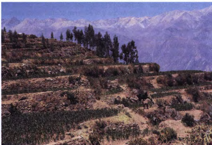
Terrazas o andenes en Cabanaconde.