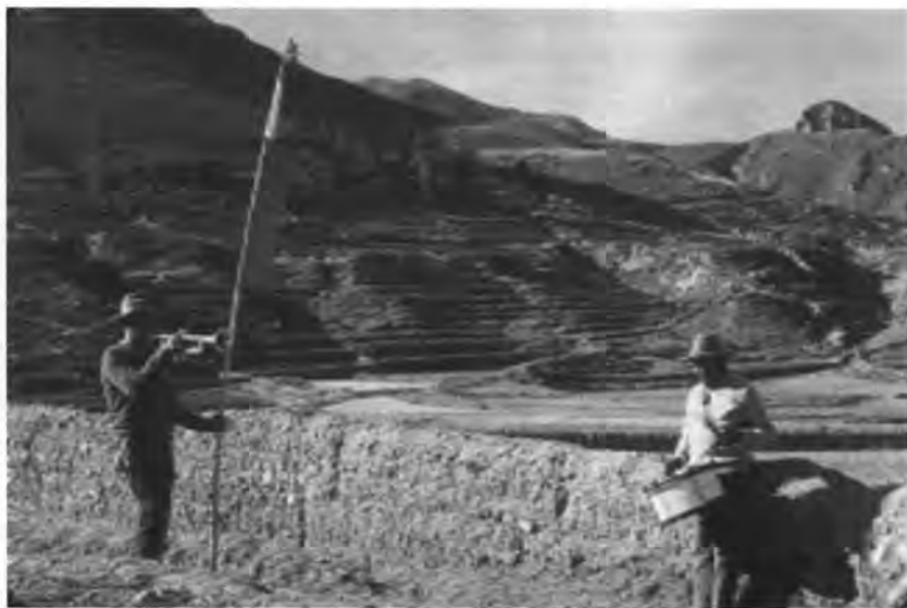
Pareja de músicos de la cuadrilla.

Como hemos señalado líneas arriba, también se llama cuadrilla al grupo de músicos que acompaña la limpieza de acequias. Si bien el conjunto está formado por dos tarolas y dos trompetas, para los días de faena o trabajo comunal se divide en pares: una corneta y una tarola acompañan a una cuadrilla de trabajadores, y el otro par acompaña a la