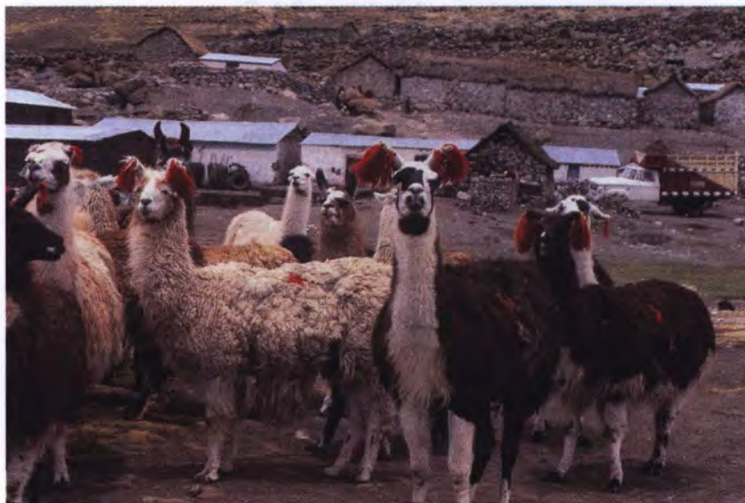
Recua de llamas en Caylloma.