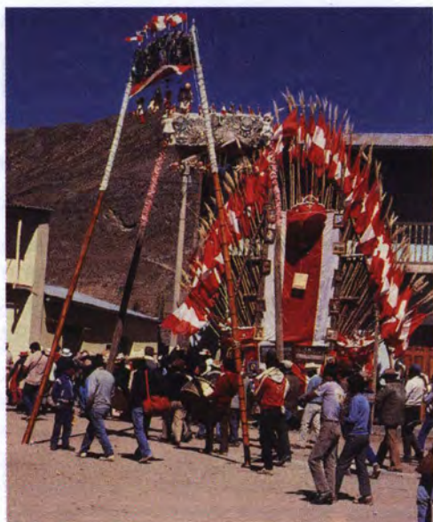
Altar y arcos.