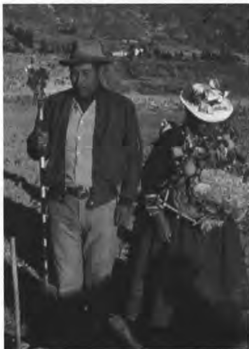
Yaku Alcalde porta su vara acompañado por su esposa.

ordena al mallkero soltar el agua, mientras la banda de música contratada por el comité de regantes para ese día empieza a interpretar diferentes marineras , huayllachas , khamiles y witites . En ese momento el yaku alcalde planta en medio de la pampa su vara 29 distintiva junto a la vara del presidente de la parcialidad; entretanto su esposa, apoyada por los pajes , va sirviendo a los comuneros pequeñas copas de caña o aguardiente y grandes vasos de chicha en sus tradicionales keros .