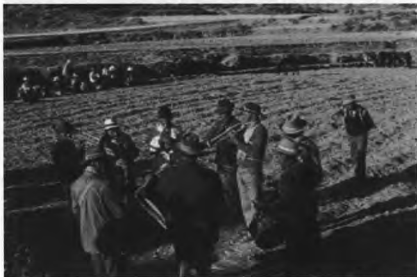
Banda de música durante la Limpieza de acequias en Yanque.

El valle del Colca no ha sido ajeno al proceso de modernización del siglo XX. Su música tradicional, propia de determinados períodos festivos, está desapareciendo o integrándose al repertorio popular regional. Un proceso de cambio también se produce en lo que respecta al uso de instrumentos musicales: los tradicionales instrumentos indios y europeos están siendo desplazados por la moderna banda de música , conjunto de inicios del siglo XX en el que predominan los sonoros instru-