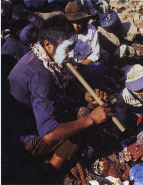
Ejecutante de la quena durante la tinka al cerro tutelar. Anexo de Pinchollo en Cabanaconde.