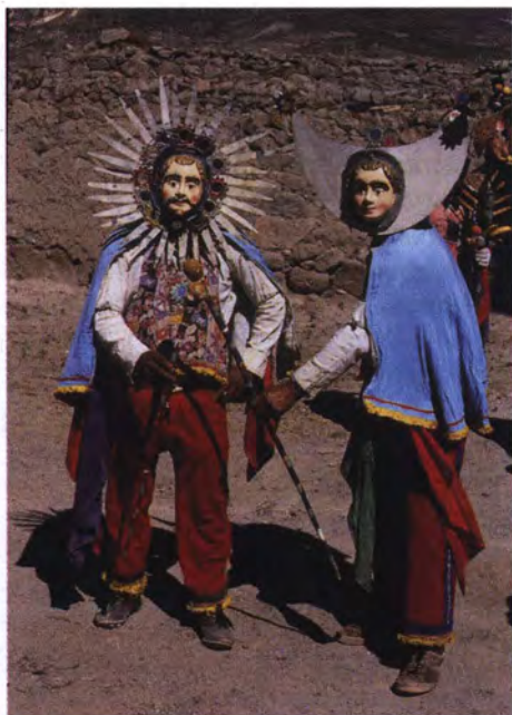
Personajes del Inti y la Quilla.