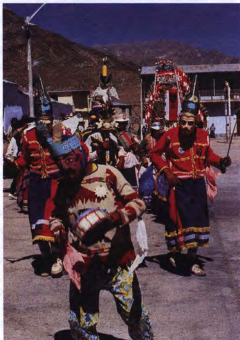
Danzantes del Turco.