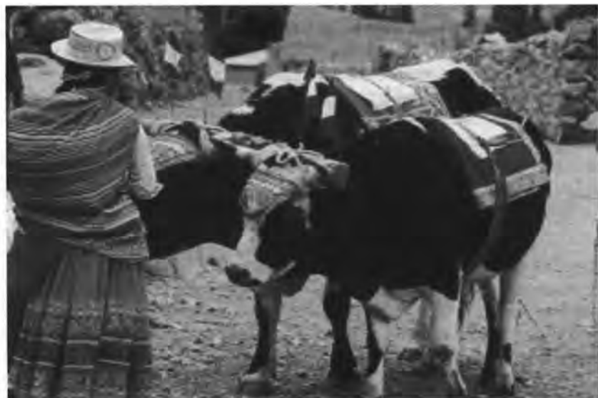
Uskiri adornando su yunta.

Cerca de las diez de la mañana, el mayordomo ordena al cohetero que se avise con algunas bombardas el inicio de la fiesta. La explosión apura a los gañanes pues han de recibir la visita del mayordomo quién va acompañado de la banda de música , quien los invita a salir a la plaza para el despacho de yuntas . Una vez que los gañanes están reunidos en la plaza, el mayordomo , junto a su banda de música , familiares y vecinos, les hace una señal para que se dirijan a Cruzpampa, donde hay una peana ubicada a las afueras del pueblo. Durante el trayecto, los músicos interpretan wifalas , huayllachas y torerías . Por lo general, el mujero va delante del grupo portando una bandera nacional. Llegado a Cruzpampa, el mayordomo agasaja a los gañanes y uskiris con abundante chicha, animándolos a proseguir su camino hacia el terreno de la Virgen Candelaria, para que vayan roturando del terreno.