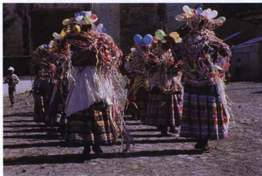
Jóvenes durante el puqllay en Achoma.