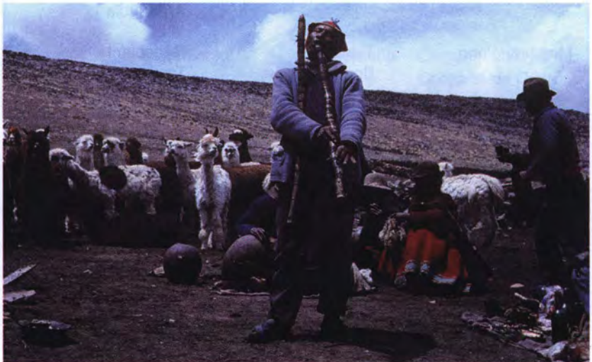
Ejecutante del pinkullo durante la tinka de Alpacas. Anexo de Canocota en Caylloma.