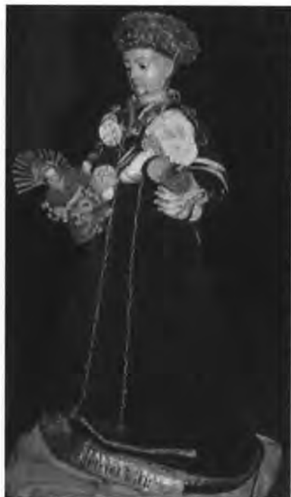
San Antonio de luto y con obsequios.