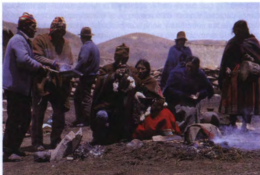
Tinka al espíritu del cerro. Anexo de Canocota en Caylloma.