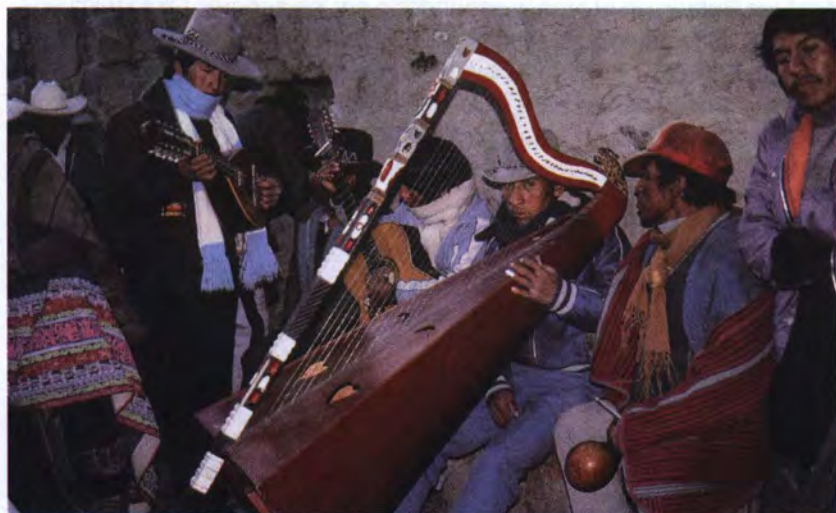
Conjunto de cuerdas "Los Caminantes del Colca" durante el rutuche.