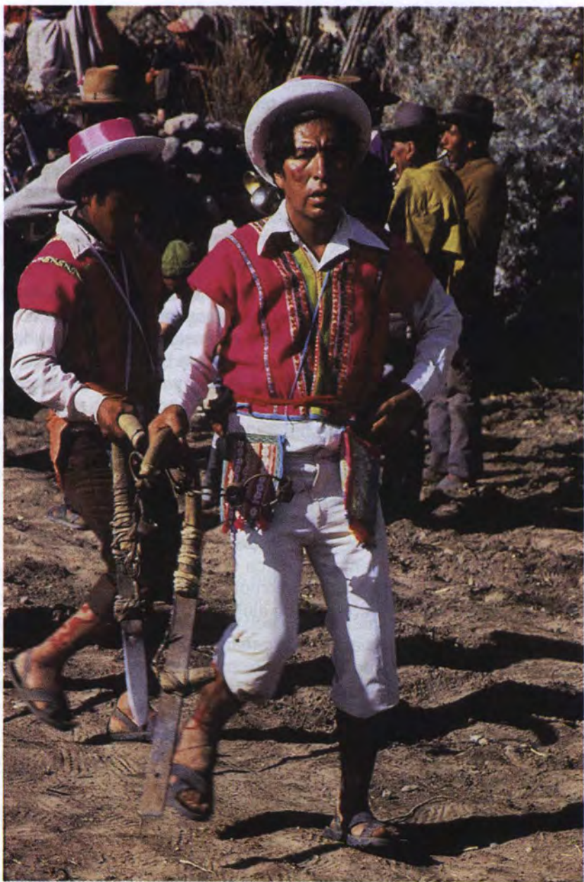
Danzante del khamile.