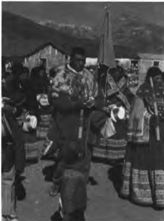
Mayordomo con su ramo y guión.

dirige a casa del voto del torero , donde realizará la ceremonia del laceado . En este ritual, el mayordomo hace las veces de ganadero y busca lancear al voto del torero "para traerlo al redil" con las mismas soguillas que se utilizará en la corrida de toros. El público presente aplaude la "habilidad del mayordomo " en colocar el lazo al cuello del voto del torero , mientras la banda de música interpreta diversas torerías . Esta ceremonia es repetida por la esposa del mayordomo con la esposa del voto del torero .