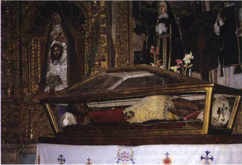
«Señor del Santo Sepulcro».