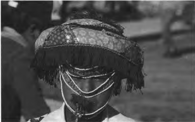
Jóven danzante del Witite. Fiesta de la Inmaculada Concepción en el distrito de Chivay en Caylloma.

cialmente en los carnavales. Para esta última fiesta, la tradición oral señala a un personaje misterioso que a caballo iba por los pueblos del valle sembrando a su paso todo tipo de riñas, accidentes y equivocaciones amorosas que debía solucionarse antes del inicio de la Cuaresma. De esta manera el carnaval, era no sólo un espacio de inversión social sino también un espacio que permitía definir las relaciones. Durante los días de carnaval, grupos de mujeres solteras van desafiando a los varones con pícaros puqllay de su propia composición y que deben ser respondidos por los varones. Como vemos, tanto la danza del witite como los puqllay guardan relación con este periodo de protección y fertilidad, iniciándose en el mes de diciembre y culminando el Miércoles de Ceniza, fecha en que se dará inicio a la Cuaresma. El ingreso a este tiempo penitencial o de silencio festivo lleva a muchos jóvenes solteros a limpiar las calles del pueblo y el atrio del templo en señal de recogimiento.