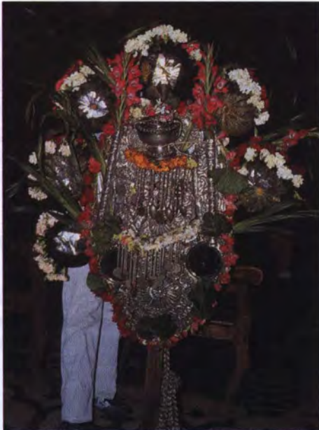
Devoto sosteniendo un Zaire.