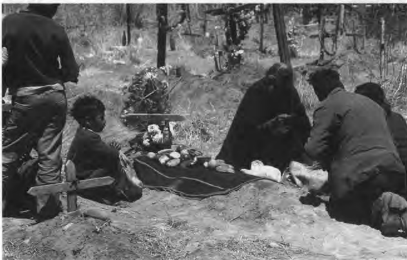
Visita al cementerio en Día de Difuntos.

A continuación comentaremos brevemente los cuatro períodos festivos en los que podemos dividir el año ceremonial del valle del Colca, influenciados principalmente por la actividad productiva, razón por la cual no tienen fechas precisas que los delimiten.