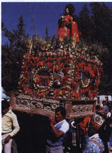
Procesión de San Juan.