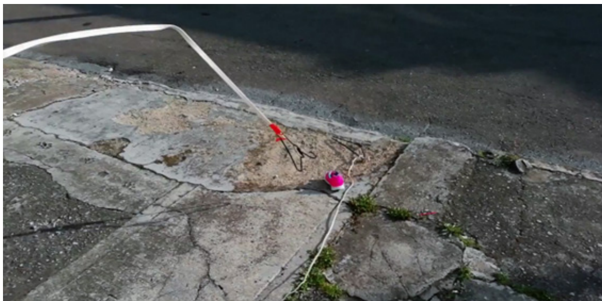
Figura 1. Pescando el afuera.