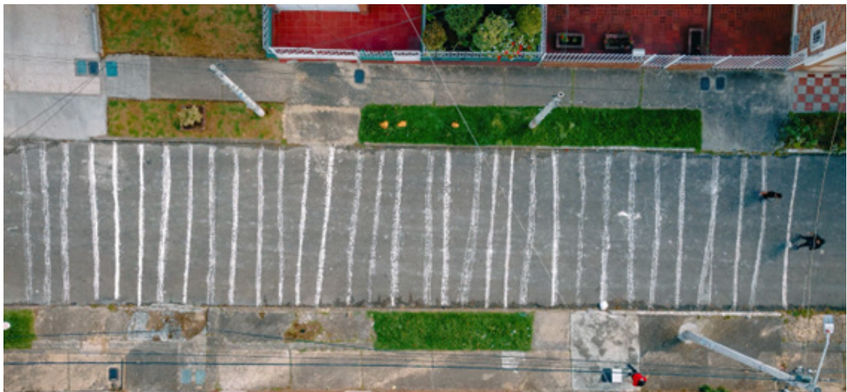
Figura 5. Carolina Carranza, Polvo eres polvo te convertirás 2.0 (video [5:59 min.]). https://youtu.be/_rUoSTJ2Jt0