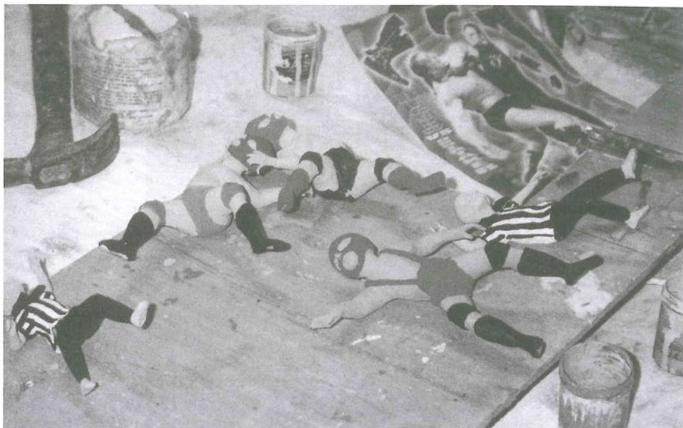
Figura 1. Cachascanistas de Alcides Quispe. Campoy, San Juan de Lurigancho, 20 de octubre de 2001.