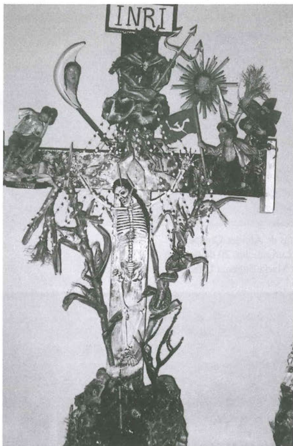
Figura 3. «La Crisis», cruz de Claudio Jiménez. Zárate, San Juan de Lurigancho, 23 de julio de 2001.